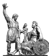
РОССИЙСКОЕ ИСТОРИЧЕСКОЕ ОБЩЕСТВО