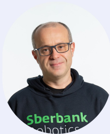
ЕФИМОВ АЛЬБЕРТ РУВИМОВИЧ

Писатель, публицист, автор ряда бестселлеров, сценарист, основатель литературно-театрального проекта «Беспринципные чтения»