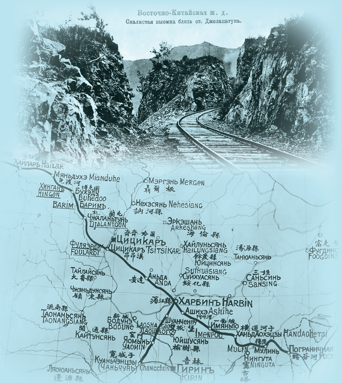
Восточно-Китайская ж. д. Скалистая выемка близ ст. Джеланьтунь.