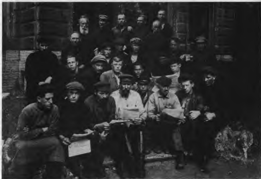
Рабочие котельной мастерской, подписавшие на 3-й заем индустриализации. Астраханский округ, 1927 г.

вынесенное рабочими еще в 1928 г., о снятии с работы одного расценщика, последний продолжал исполнять обязанности вплоть до конца 1929 г. На заводе в г. Сталино с числом рабочих 16 496 человек, в июле 1929 г. бастовали две группы рабочих в связи с невыполнением пункта договора о зарплате. В доменном цехе при обсуждении нового колдоговора, под влиянием выступлений отдельных лиц, значительные группы рабочих демонстративным уходом сорвали собрание 83 .