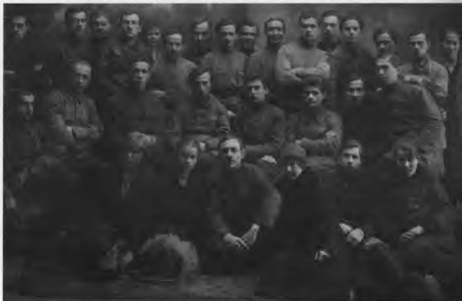
Сотрудники контрразведывательного отдела Московского губотдела ГПУ. Начало 20-х годов