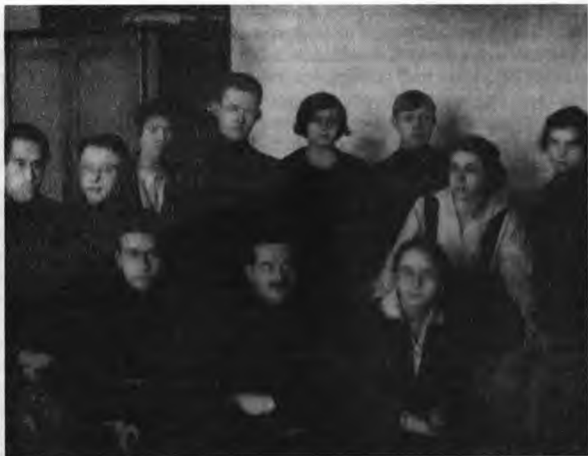
И.С. Уншлихт с сотрудниками секретариата коллегии ГПУ. Середина 20-х годов

другого лица должны были представляться: телеграфно или в виде еженедельных сводок разыскиваемых 40 .