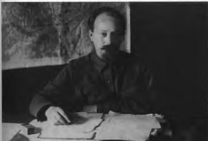
Председатель ЧК–ОГПУ Ф.Э. Дзержинский

данных указаний. 2. Груз должен быть отправлен большой скоростью. 3. Груз должен сопровождать надежный сотрудник, который является ответственным за его срочную доставку, целость и сдачу. 4. В случаях невозможности по каким-либо основательным причинам передать весь архив целиком, допускается его передача по частям. Ответственность за исполнение данного приказа возлагается на Начальников соответствующих органов ГПУ” 16 .