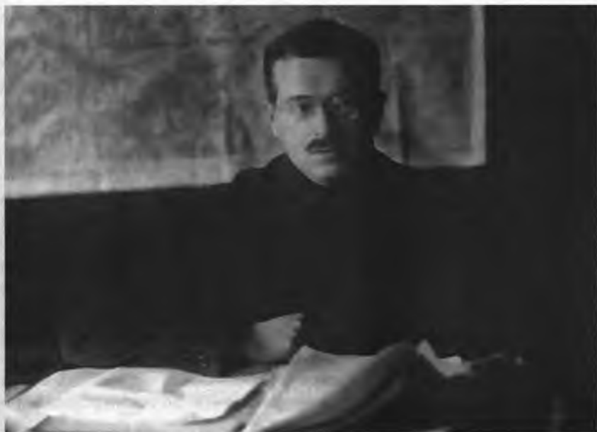
Заместитель председателя ОГПУ в 1921–1923 г. И.С. Уншлихт

ник информационного подразделения губернской ЧК, председатели губернских комитетов партии и исполкомов Советов. В ней кратко излагались основные вопросы по содержанию госинфсводок, объем текста которых не должен был превышать двухсот слов. По содержанию, характеру и существу вопросов новые сводки практически не отличались от тех, которые ранее фигурировали в названных выше распорядительных документах, причем в телеграмме специально отмечалось, что “чисто ведомственные чекистские сводки” отмене не подлежат 32 .