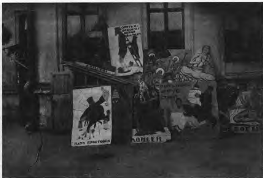
Антирелигиозные плакаты к "Комсомольской пасхе", 20-е годы

неправильных и произвольных действий администрации, об организации противодействия органам советской власти и ее политике. Иногда высказывались идеи создания крестьянского союза с ячейками в каждом уезде и волости – "Союз крестьян, который объединит всех тружеников земли СССР". В ряде случаев крестьяне, защищая идеи создания крестьянских союзов, рассматривали их не только как средство защиты интересов крестьян, но и как фактор политического влияния, как способ реализации сепаратистских замыслов, например "независимости Кубани".