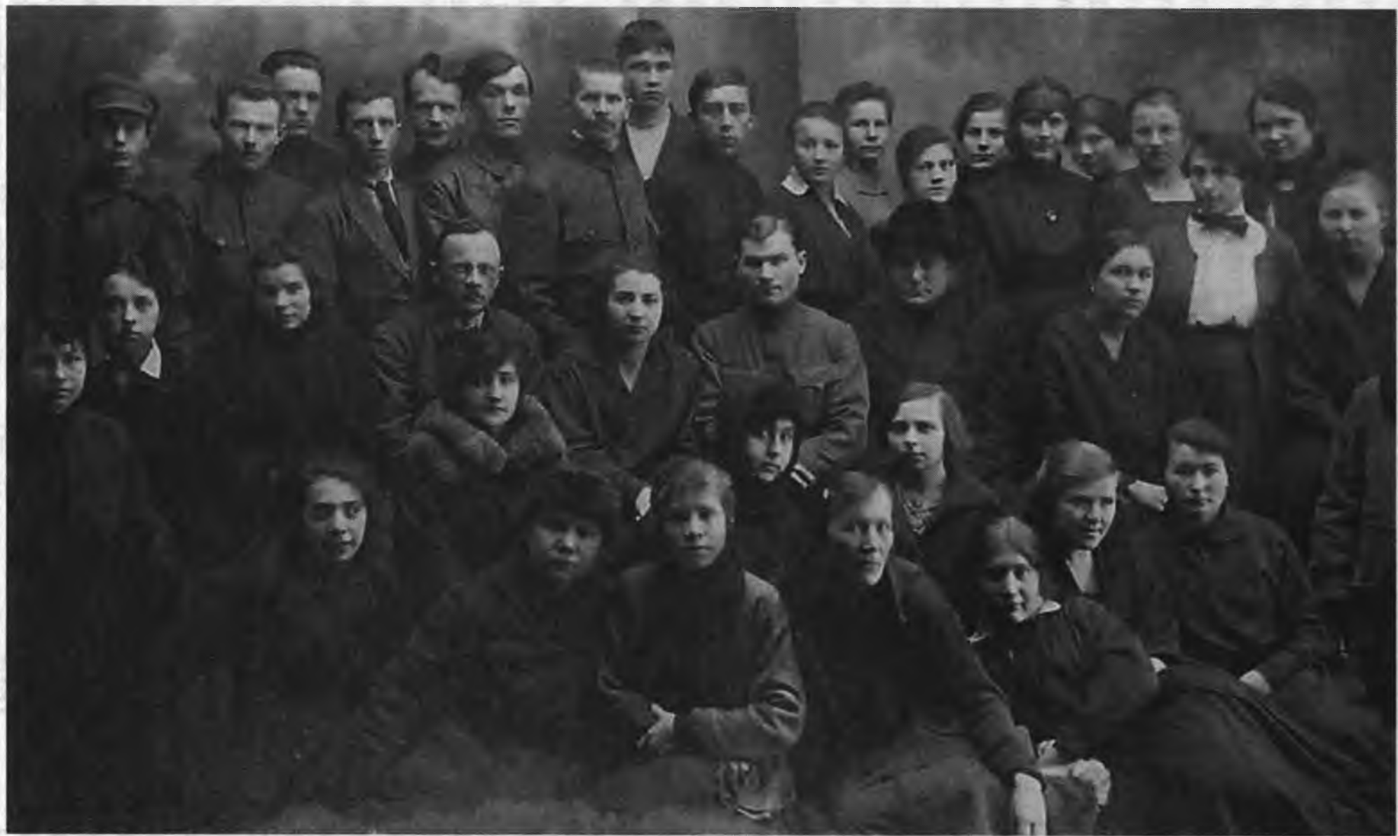
Сотрудники Информационного бюро ГПУ. Начало 20-х годов