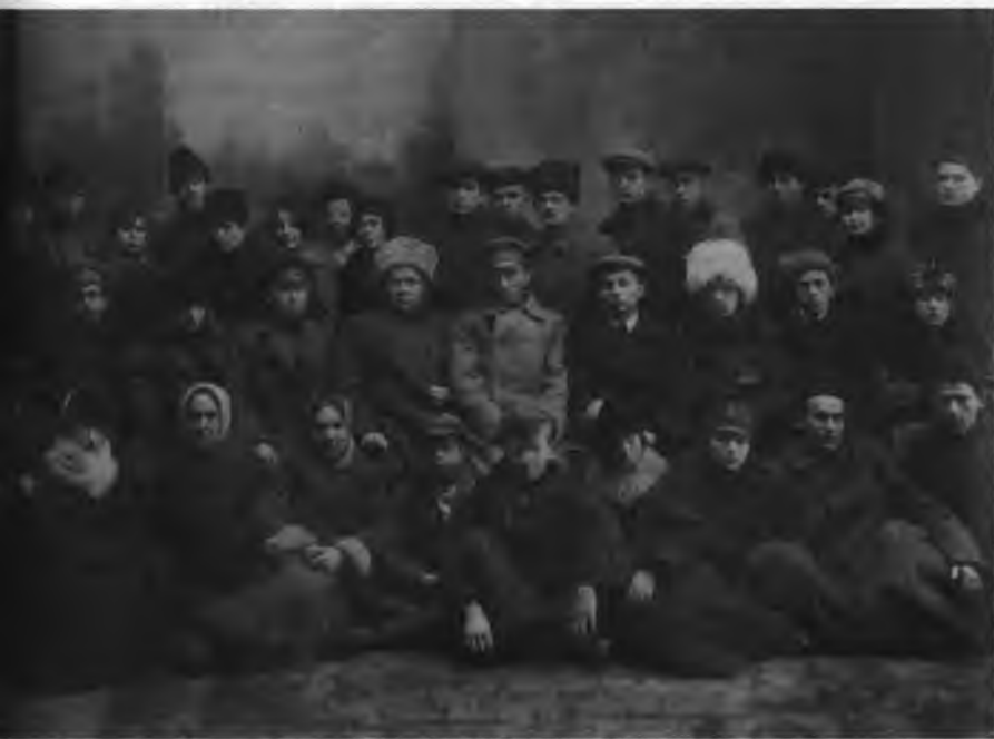
Сотрудники Специального отдела ГПУ. В центре в шинели – начальник отдела Г.И. Бокий

С точки зрения региональной, более активным считался Московский комитет 78 , который довольно регулярно выпускал листовки и планировал приступить к изданию постоянного органа социал-демократической молодежи “Юный пролетарий”. На местах меньшевики вели работу главным образом в профсоюзах.