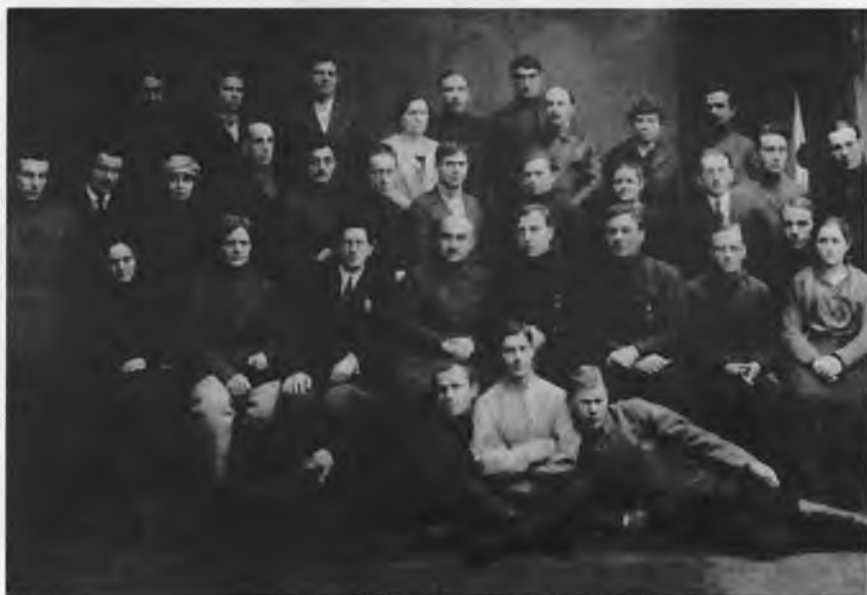
Сотрудники Экономического управления ОГПУ

деятельности “вредительских организаций”. Чтобы не перегружать сводки, конкретные сроки при этом не устанавливались, но предусматривалась периодичность не реже двух раз в месяц. Однако ход хлебозаготовок требовалось освещать и в еженедельных сводках 79 .