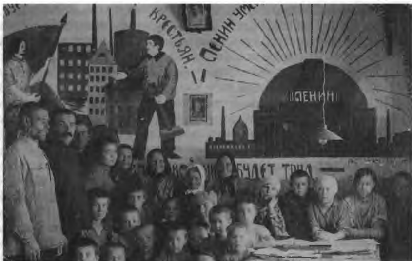
Красный уголок сельсовета. Плакат "Владыкой мира будет труд!" 20-е годы

ственников усматривали причину кризиса в ошибочности курса партии. Для выхода из создавшегося положения предлагалось изменить взаимоотношения между городом и деревней, добиться их большей сбалансированности. Но для борьбы с хлебозаготовительным кризисом был избран иной путь. Для активизации хлебозаготовок руководство страны прибегло к чрезвычайным мерам, напоминающим политику периода "военного коммунизма". Запрещалась свободная рыночная торговля зерном. При отказе продавать хлеб по твердым ценам крестьяне подлежали уголовной ответственности, местные Советы могли конфисковать часть их имущества. Особые "оперуполномоченные" и "рабочие отряды" изымали не только излишки, но и необходимый крестьянской семье хлеб. Эти действия привели к обострению отношений между государством и сельским населением, которое в 1929 г. уменьшило посевные площади.