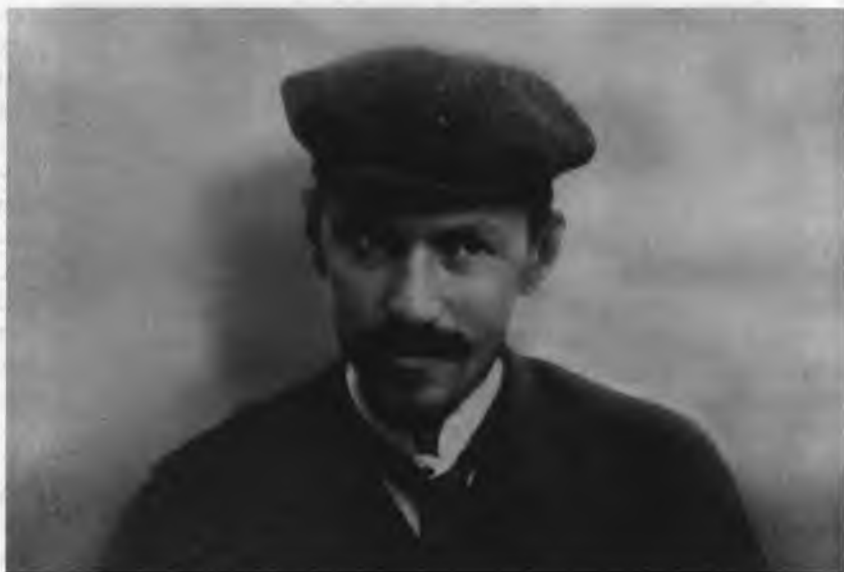
В.Р. Менжинский – заместитель председателя (1923–1926), председатель ОГПУ (1926–1934)

бые отделы губчека округов, фронтов и армии, охраны границы; транспортные ЧК на железных дорогах, водных путях и т.д.). Их оперативно-розыскная и следственная работа осуществлялась в армейской и железнодорожной среде, в окружении военных учреждений и штабов, складов вооружений, вокруг управлений, отделов и участков железных дорог и водных путей и т.п.