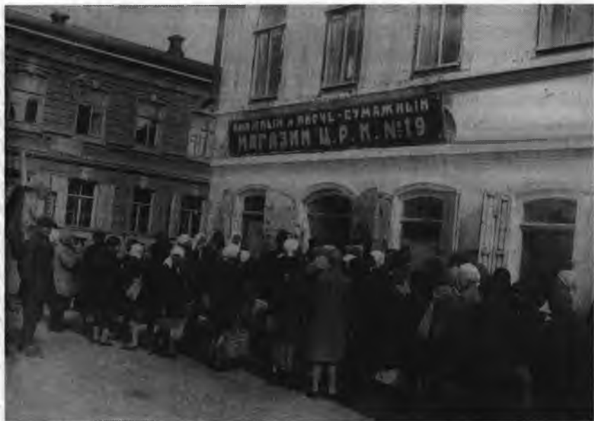
Очередь у кооперативного магазина. Камышин, 20-е годы

вопросы хозяйства, которые все больше запутывают и затрудняют Рыковы и Сталины” 10 .