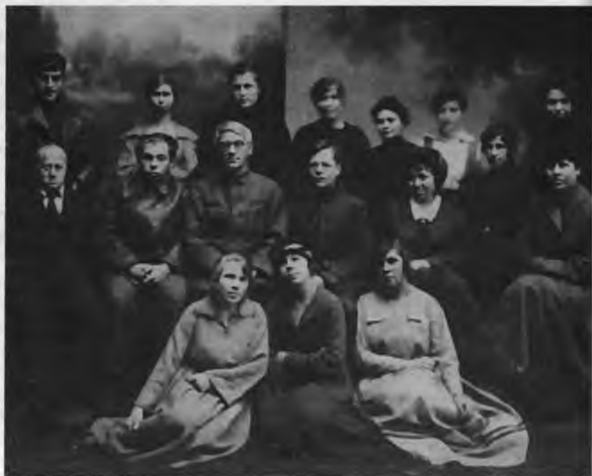
Сотрудники ИНФО ОГПУ. Начало 20-х годов

литическую работу. Подразделения информации ВЧК (отделения, бюро, столы) создавались для организации и налаживания работы во всероссийском масштабе. В этих подразделениях сосредоточивалась текущая оперативная информация с мест, полученная в ходе деятельности чрезвычайных комиссий на подведомственной им территории, а также сведения, собранные из открытых источников. Эти сообщения направлялись территориальными аппаратами в Иногородний отдел ВЧК, образованный решением Коллегии от 18 марта 1918 г. для руководства, организации работы и связи с местными ЧК. Тогда же в составе отдела начало функционировать специальное Информационное бюро 17 . А 20 декабря 1918 г., заслушав предложения члена Коллегии Н.А. Скрыпника, Президиум ВЧК поставил перед Информационным бюро задачу обобщения сведений, поступавших из отделов Комиссии, других учреждений, а также с территорий, включая местную печать. Как указывалось, вся информация должна была сводиться “в один ежедневный общий доклад – обзор для представления в Президиум, который использует его при выработке своего доклада, представляемого в Совнарком” 18 .