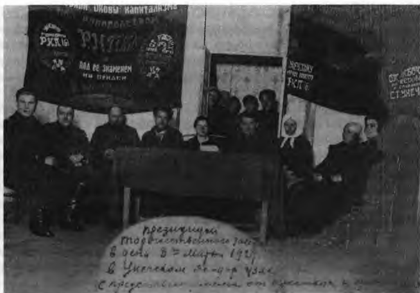
Президиум торжественного заседания 8 марта 1927 г. в Унечском ж/д узле с представителями крестьян и крестьянок

дельцу. После этого толпа до 50 женщин якобы под видом собрания потребовала прекращения работы комиссии, угрожая последней расправой. По распоряжению стансовета милиция арестовала из толпы семь человек подстрекателей. 18 марта в 12 час. 30 мин. к зданию сельсовета устремилась уже толпа в 300 человек, преимущественно женщин и молодежи, и потребовала немедленного освобождения арестованных женщин, прекращения работы комиссии и запрещения производства обысков в дальнейшем. В тот же день в 13 час. 45 мин. около здания стансовета вновь столпились женщины, которые требовали освобождения арестованных и прекращения работ комиссии. Никакие угрозы разойтись не подействовали, и только с наступлением темноты толпа начала расходиться. Окружной комитет ВКП(б) вынес решение произвести всестороннее расследование и виновных привлечь к ответственности.