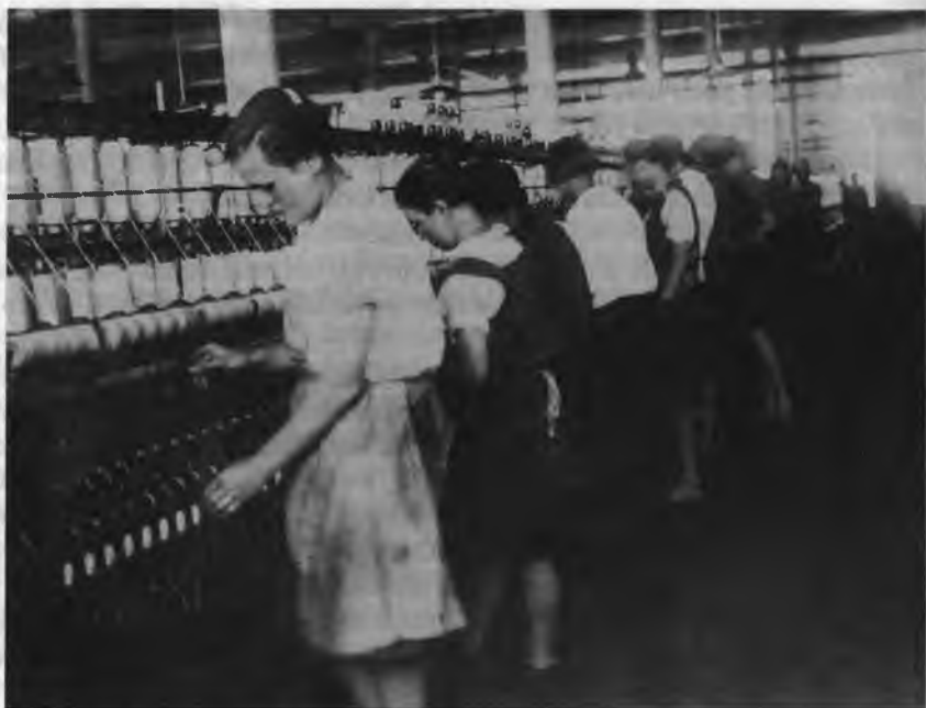
Комсомольская ударная бригада работает “на ватерах”, 1929 г.

В апреле 1925 г. имел место дальнейший рост числа конфликтов в промышленности. Число забастовок за месяц увеличилось по сравнению с мартом (24 забастовки), но они отличались большей остротой и тенденцией к распространению на соседние предприятия. Кроме того, забастовки в апреле 1924 г. приходились преимущественно на главные отрасли промышленности: текстильную (число забастовок возросло с трех в марте до восьми) и металлургическую (с четырех до восьми). Причинами конфликтов по-прежнему оставались недовольство низким уровнем зарплаты при дальнейшем возрастании норм выработки и ненормальности проводимой кампании по увеличению производительности труда.