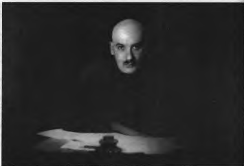
Г.Г. Ягода – в 1920–1924 гг. начальник Особого отдела, который вел борьбу со шпионажем и контрреволюционными выступлениями

В записке особо подчеркивалась важность подготовки месячных политических обзоров по СССР для ЦК РКП(б) и высших органов государственной власти. “Эти доклады, – указывалось в документе, – составляются обязательно с анализом приведенного фактического и цифрового материала и соответствующими выводами” 47 .