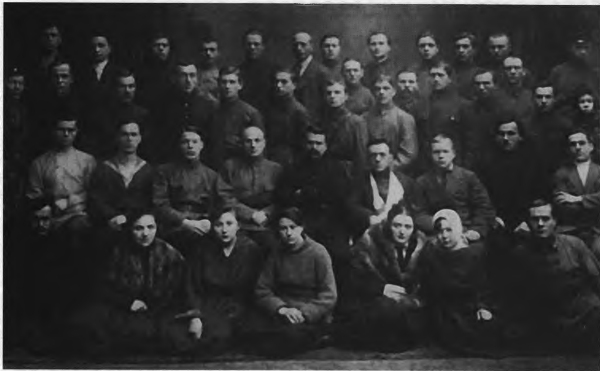
Сотрудники Оперативного отдела ГПУ (вел наружное наблюдение и разведку), 1922 г.