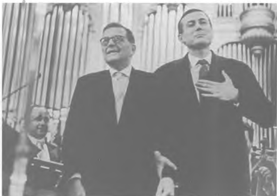
Д.Д. Шостакович и Е.А. Евтушенко. Выход к публике после исполнения 13-й симфонии («Бабий Яр»). 18 декабря 1962 г. (Фото В. Ахломова).