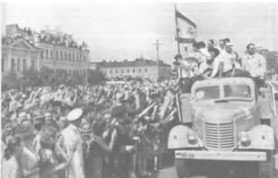
Москвичи приветствуют израильскую делегацию, участвовавшую в Международном фестивале молодежи и студентов. Август 1957 года.