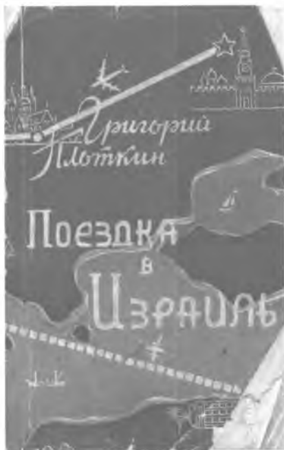
Обложка книги Г. Плоткина.