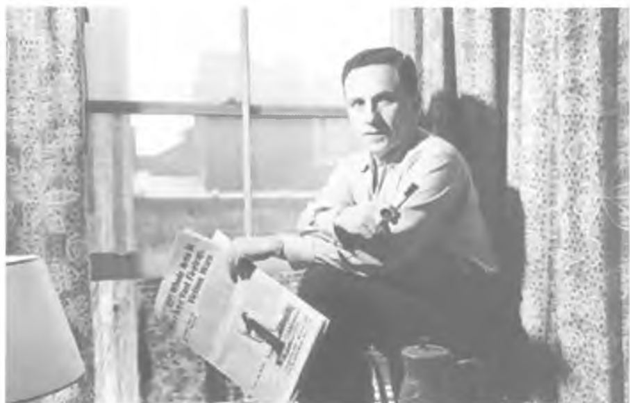
Джон Гейтс. 1958 год