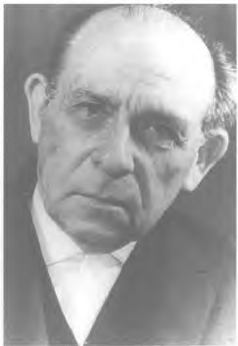
Ш. Авигур – глава израильской спецслужбы «Натив» (1952–1970 гг.). 1960 год.