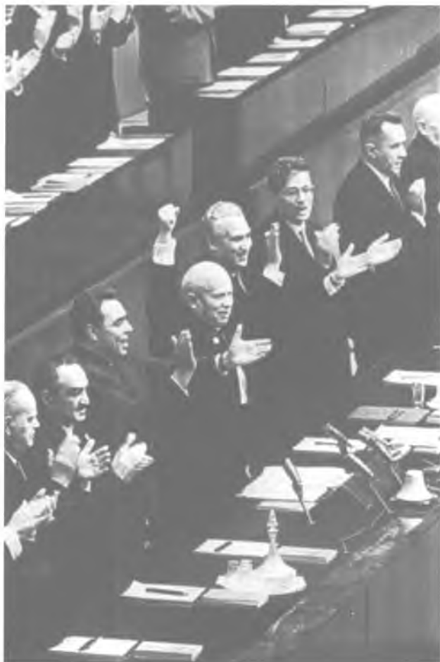
Президиум XXII съезда КПСС. Октябрь 1961 года.