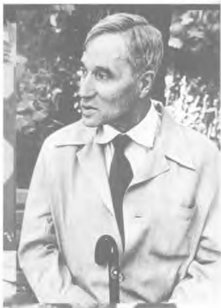
Б.Л. Пастернак в последние годы жизни.