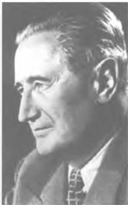
Н. Гольдман – руководитель Всемирной сионистской организации и Всемирного еврейского конгресса.