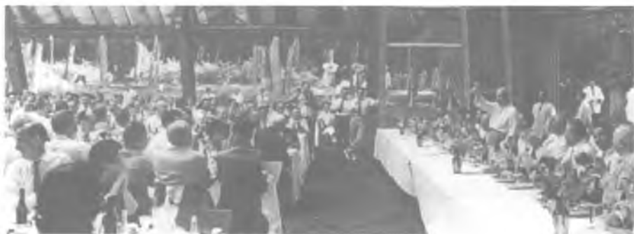
На встрече советского руководства с творческой интеллигенцией. Семеновское (Подмосковье). Июль 1960 года.