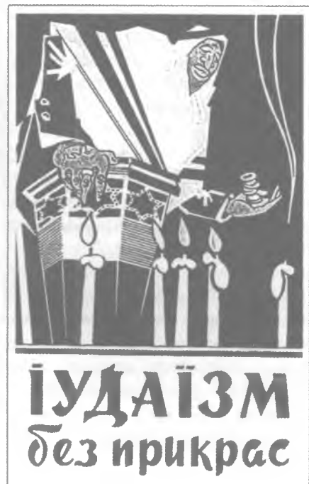
Обложка книги Т. Кличко.