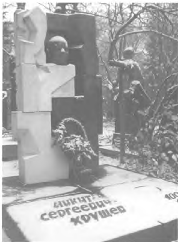
Надгробный памятник Н.С. Хрущёву на Новодевичьем кладбище в Москве (скульптор Э.И. Неизвестный).