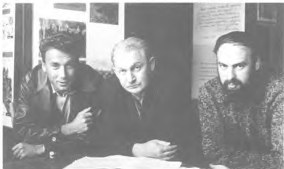
Слева направо: В.С. Фогельсон (редактор альманаха «День поэзии»), поэты Б. А. Слуцкий и В.Н. Корнилов. 1965 год.