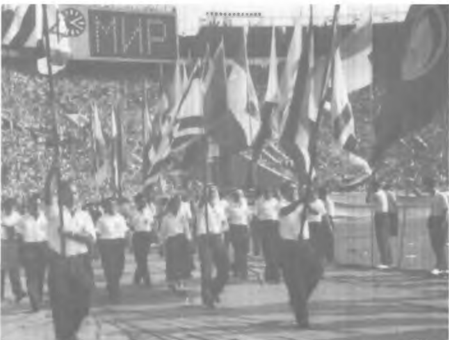
Проход израильской делегации по стадиону в Лужниках на открытии молодежного фестиваля в Москве. Август 1957 года.