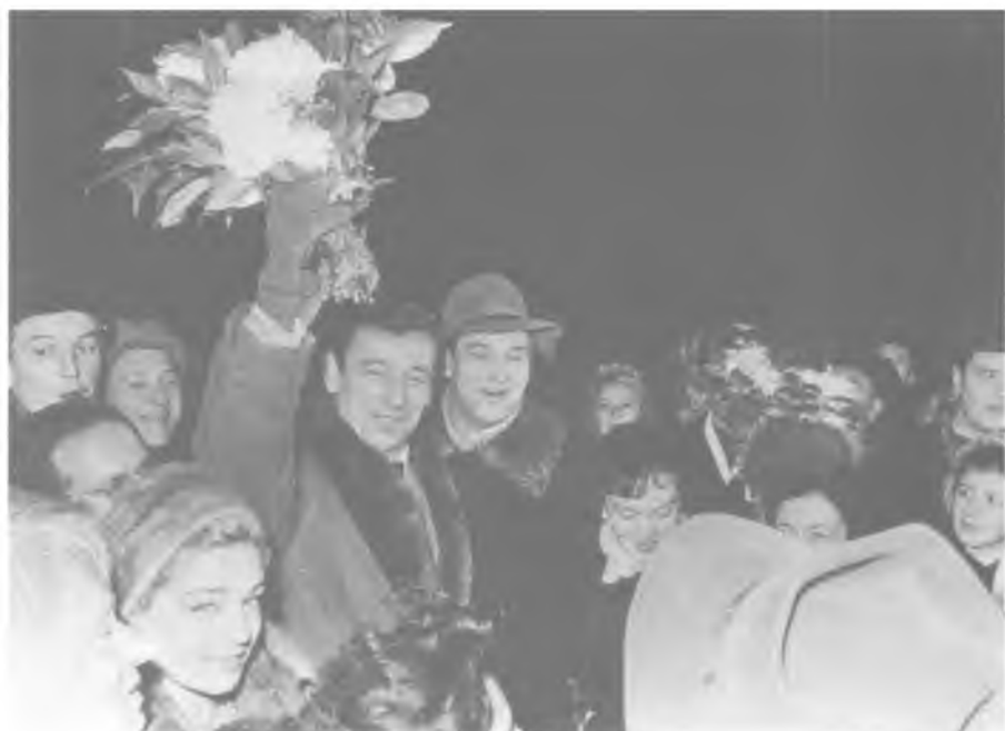
Встреча Ива Монтана и Симны Синьоре в московском аэропорту. Декабрь 1956 года.