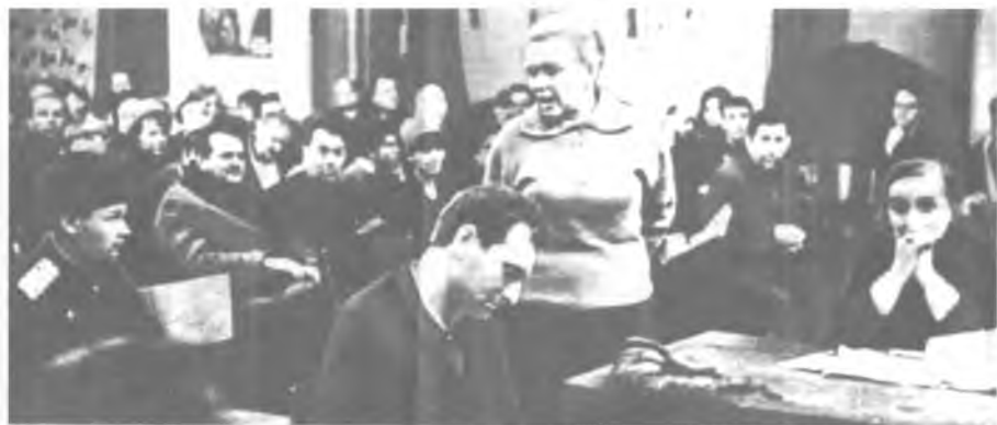
Суд над И. Бродским. 1964 год.