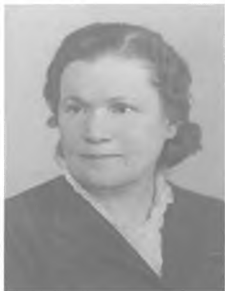
Историк А.М. Панкратова.