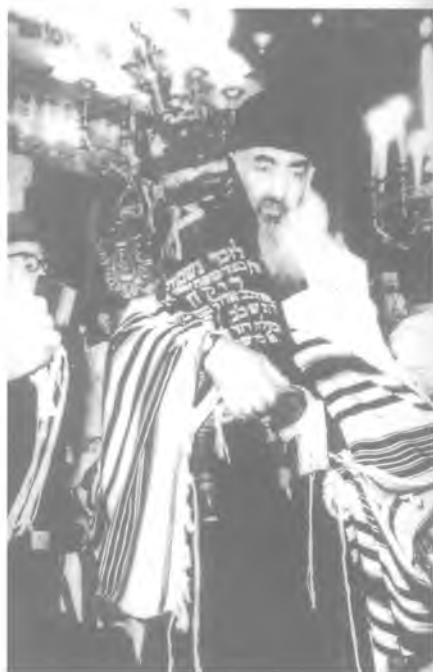
Главный раввин И.-Л. Левин.