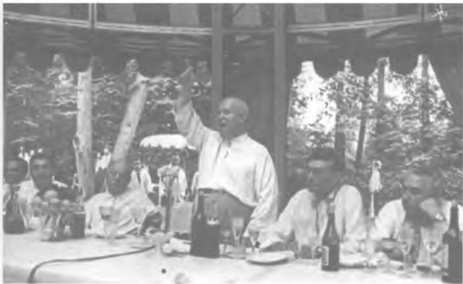
Выступление Н.С. Хрущёва на встрече советского руководства с творческой интеллигенцией. Семеновское (Подмосковье). Июль 1960 года.