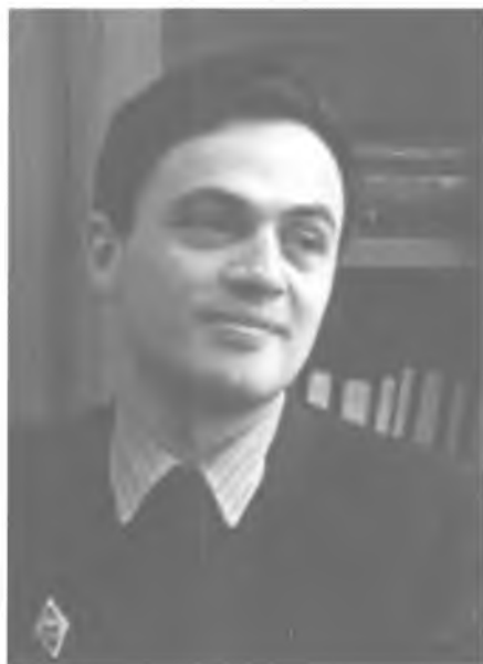
Историк и филолог Н.Я. Эйдельман.