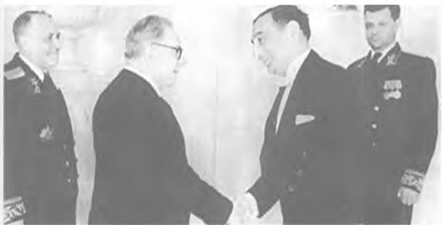
Председатель Президиума Верховного Совета СССР К.Е. Ворошилов принимает в Кремле верительную грамоту от израильского посланника Ш.Эльяшива. Декабрь 1953 года.