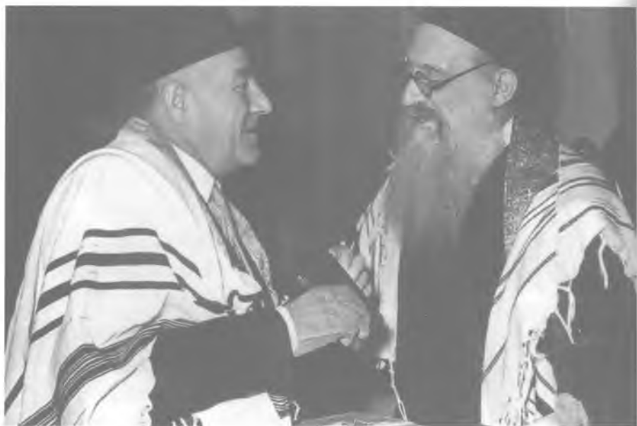
Главный раввин Московской Хоральной синагоги С. Шлифер (справа) и посол Государства Израиль Й. Авидар.