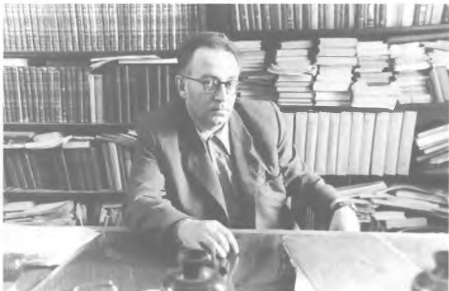
Василий Гроссман в рабочем кабинете.