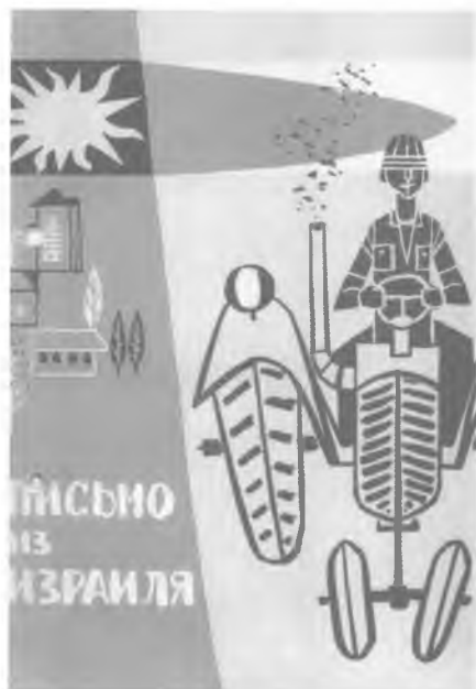
Обложка израильской пропагандистской брошюры, распространявшейся на фестивале в Москве, 1957 год.