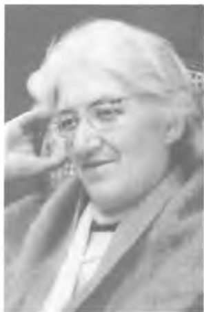
Л. К. Чуковская.