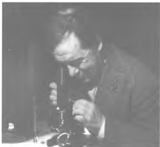
В.Д. Дудинцев, 1961 год..