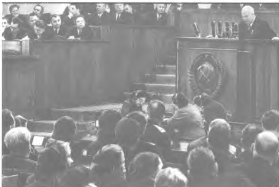
Выступление Н.С. Хрущёва на XX съезде КПСС. Февраль 1956 года.