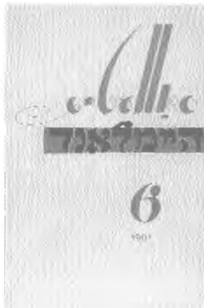
Обложки и титульный лист журнала “Советиш Геймланд”.