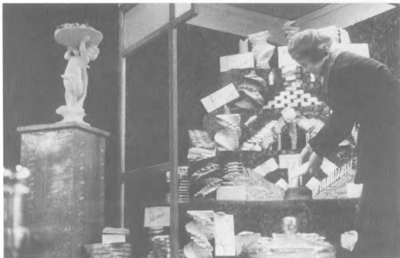
Оформление витрины магазина в Свердловской области, 1936.