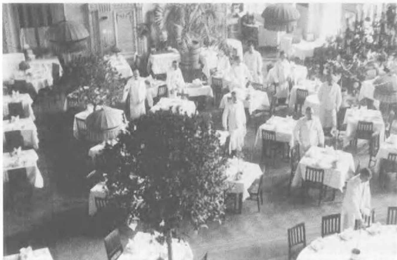
Москва, 1931. Ресторан «Гранд-отеля». Даже в лучших ресторанах страны во время карточной системы вводились нормы питания.