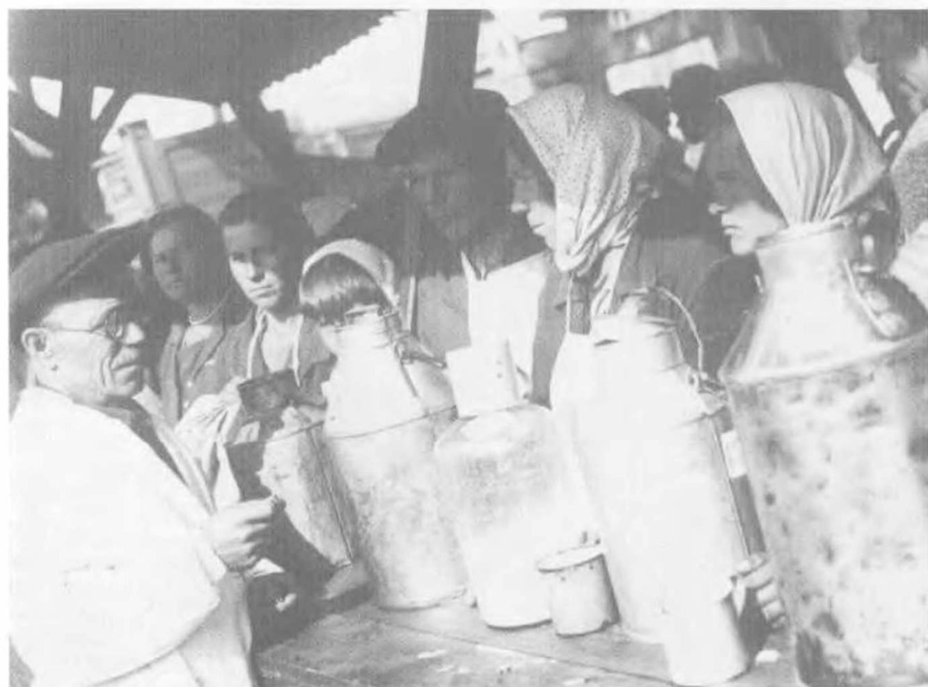
Санитарный врач на Петровском рынке ведет беседу о чистоте молочной посуды. Москва, 1934.