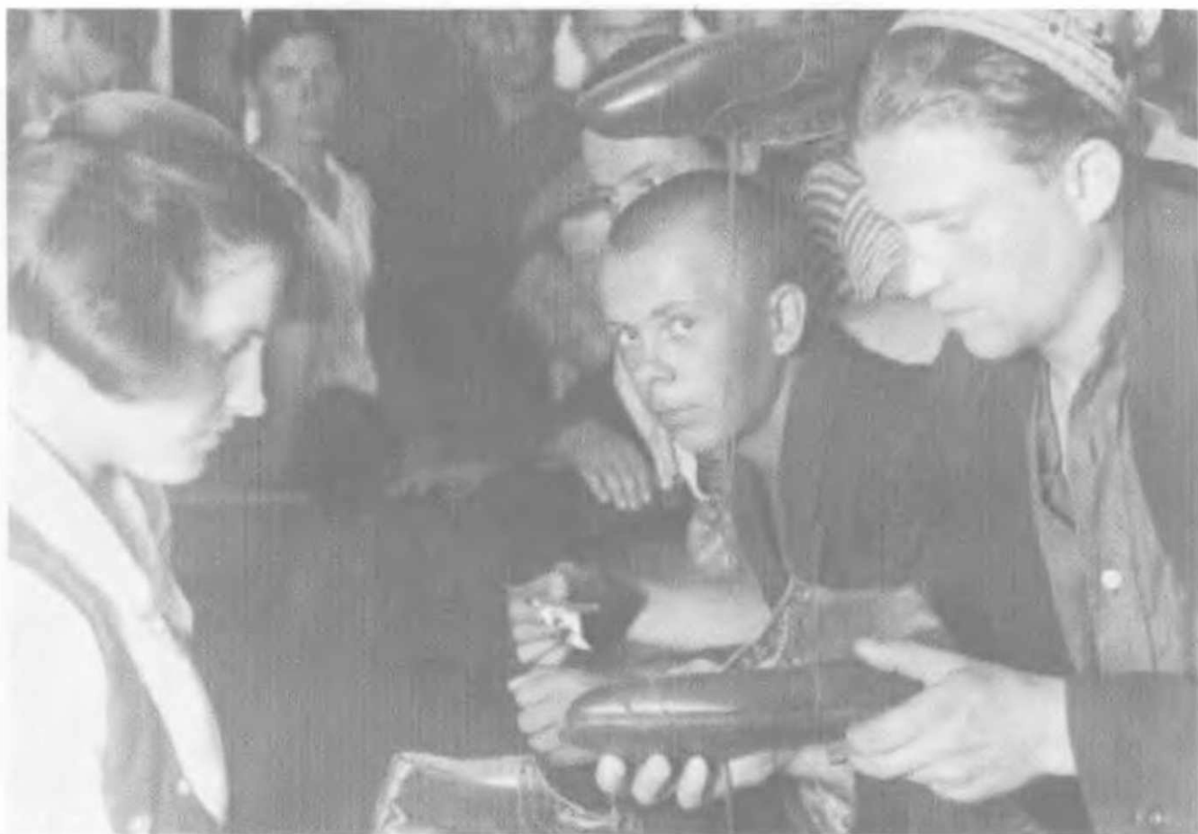
ЗРК Электростанции, 1931. Явно показное фото. Положение с непродовольственными товарами в стране было еще хуже, чем с продовольствием. Получить по карточкам такие ботинки на производстве реально могли лишь несколько человек.