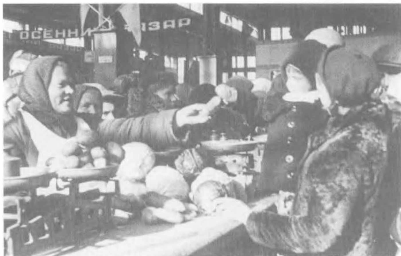
Осенний базар на Зацепском рынке в Москве, 1939.