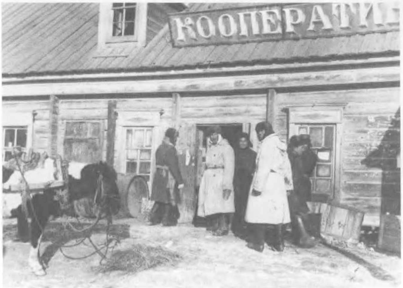
Сельский кооператив. Деревня на пороге коллективизации. Астрахань, 1929.