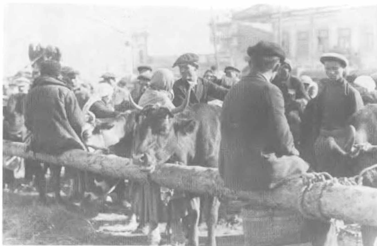
Продажа скота, 1933. Место не указано.