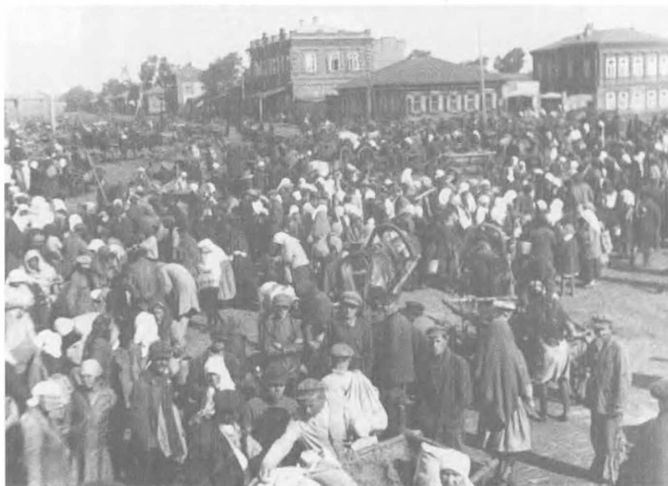
Продажа с крестьянских подвод и возов. Башкирия, 1932.