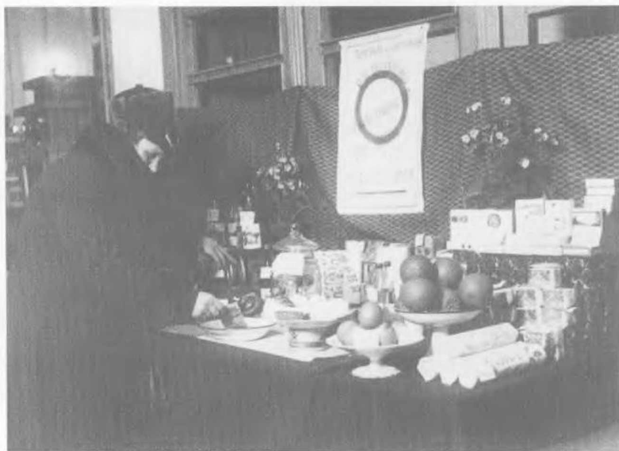
Продажа товаров без продавца в универмаге по обслуживанию работников НКВД. Сталинград, 1936.