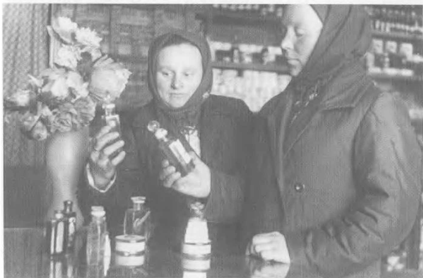
Колхозницы в парфюмерном отделе. Куйбышевская обл., 1937.