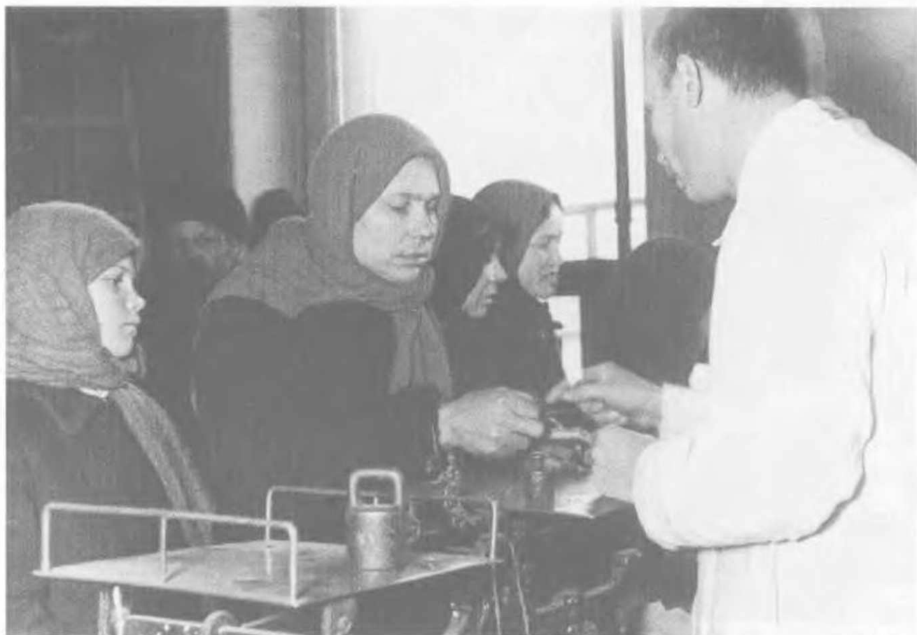
Торговля в первый день введения хлебных карточек в столице. Продавца заменил резчик, чьей обязанностью стало быстро нарезать пайки хлеба. Москва, 1929 год.