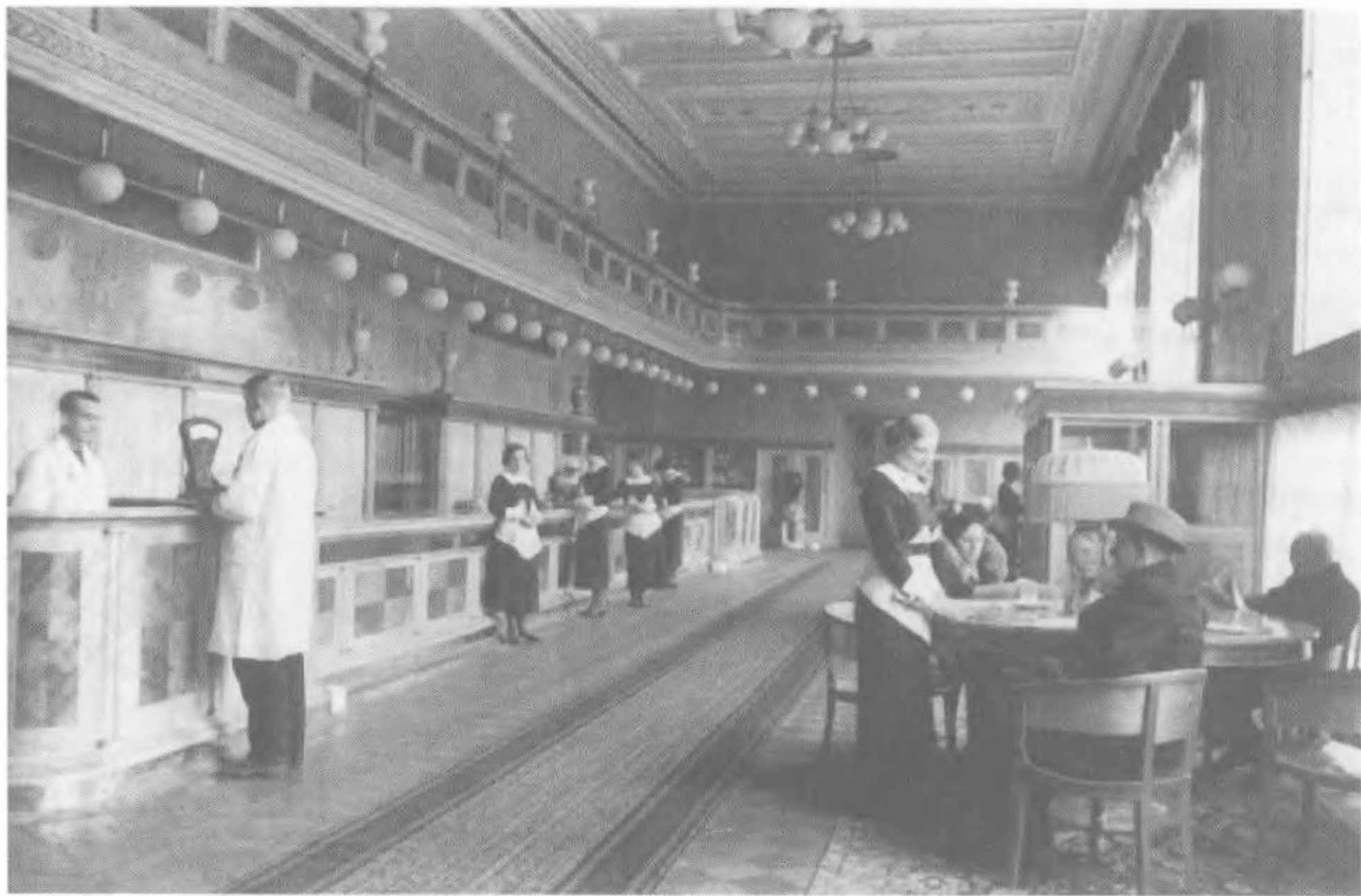
Зал ожидания в бюро заказов «Стрела», которое доставляло продукты на дом работникам НКВД. Москва, 1936. За столами ожидают своей очереди сделать заказ «люди в штатском».