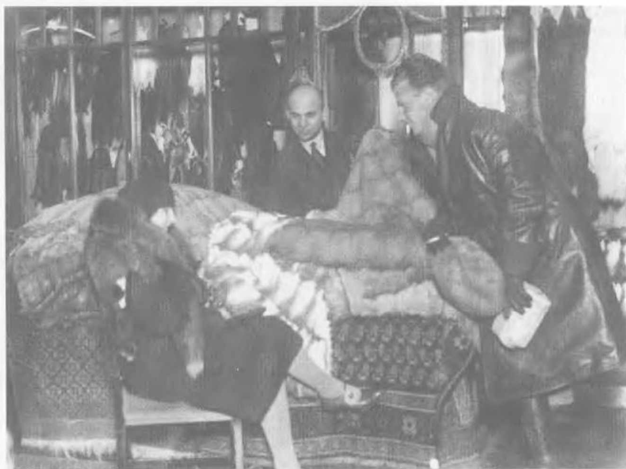
Москва, 1932. меховой отдел Торгсина. Рекламное фото. Глядя на эту фотографию, трудно поверить, что страна уже стоит на пороге массового голода, который унесет миллионы человеческих жизней.