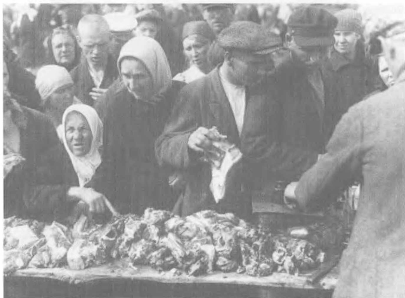
Торговля свиной на Воронцовском рынке. Орехово-Зуево, Подмосковье, 1932.