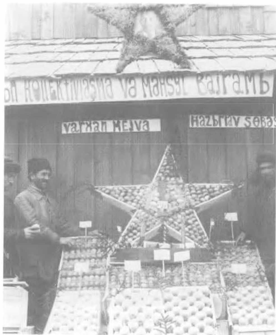
Продажа фруктов на базаре в Кутаиси, Грузия, 1931. Обращает внимание тщательная упаковка — видно, что частник старался. Оформление включает советскую символику — пятиконечные звезды, портрет Ленина.