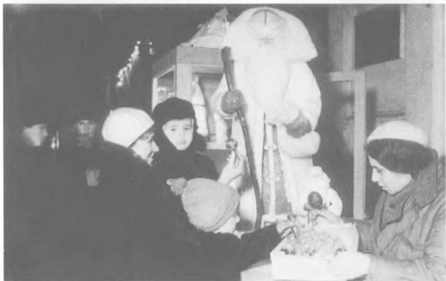
Еще один момент новой, более благополучной жизни — елочные украшения Союзкультторга, Москва. Люди готовятся встречать 1937 год, не подозревая, сколько горя он им принесет. Массовые репрессии уже не за горами.