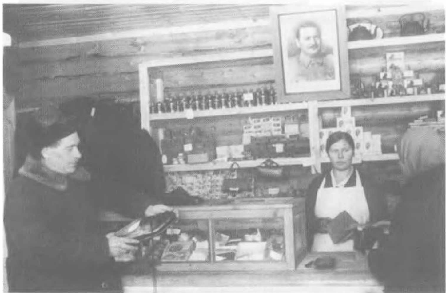
Сельмаг в Ленинградской обл., 1938. На стене портрет «хозяина» — секретаря Ленинградского обкома и горкома, А.А.Жданова.