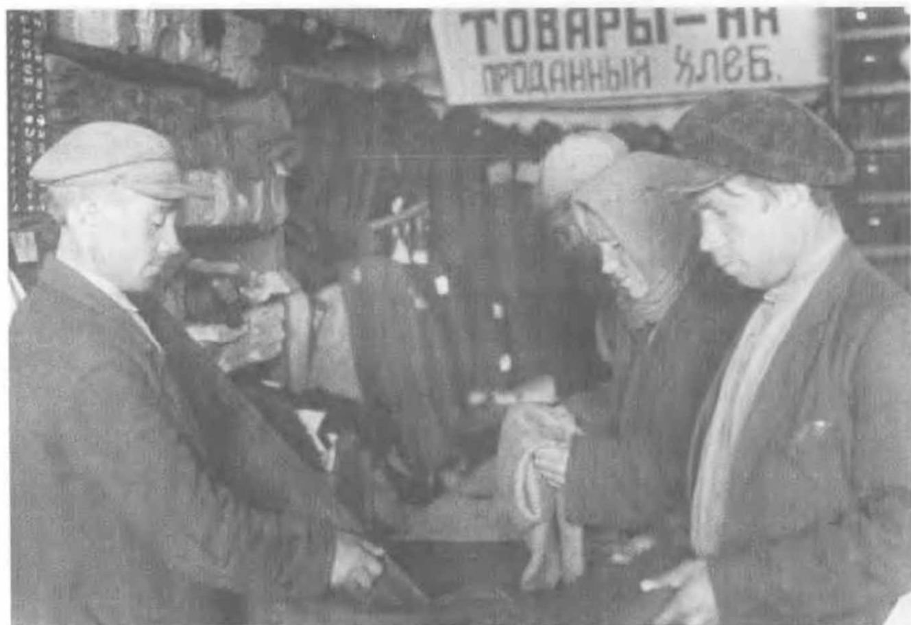
«Хлебосдача — первая заповедь» — учил Сталин. Крестьяне отоваривают квитанции, полученные за сданный государству хлеб. Сельпо в Челябинской обл., 1934.