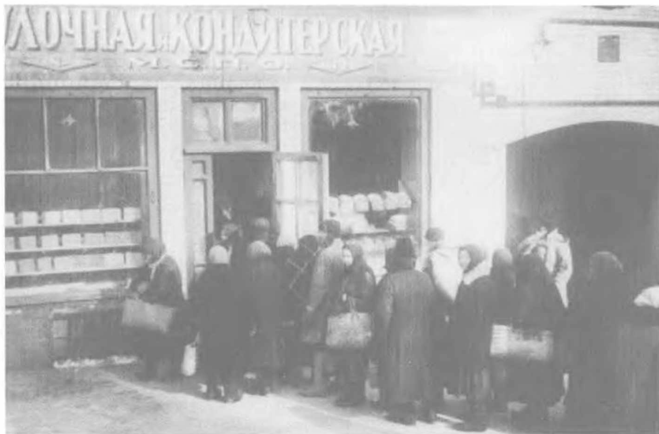
Очередь за хлебом по карточкам. Москва, 1929 год.