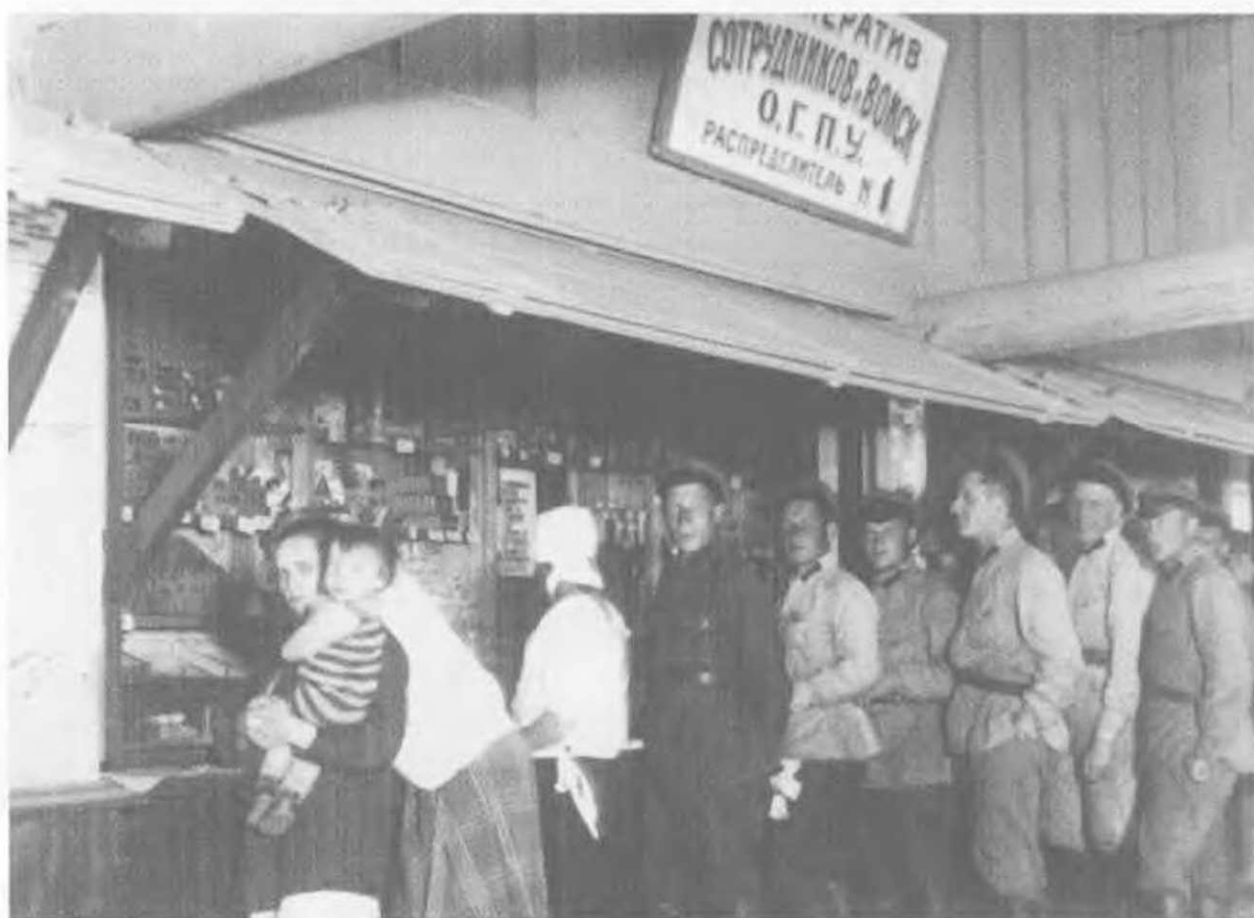
Распределитель кооператива ОГПУ в лагерях, 1928.