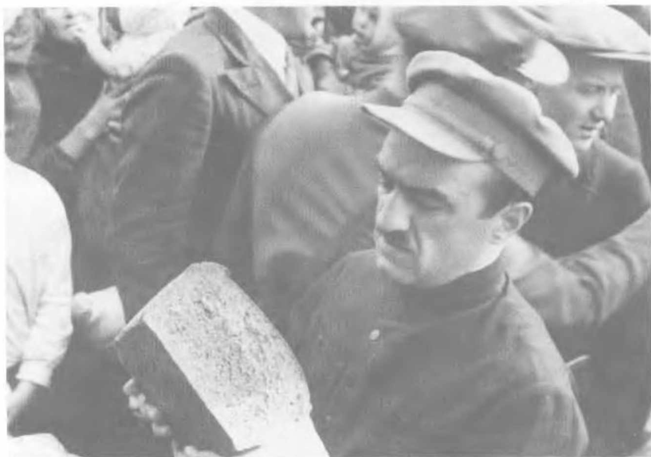
Бывший нарком снабжения, а теперь нарком пищевой промышленности А.И.Микоян проверяет качество выпеченного хлеба во время посещения поселка «Дальние зеленцы» (1935).