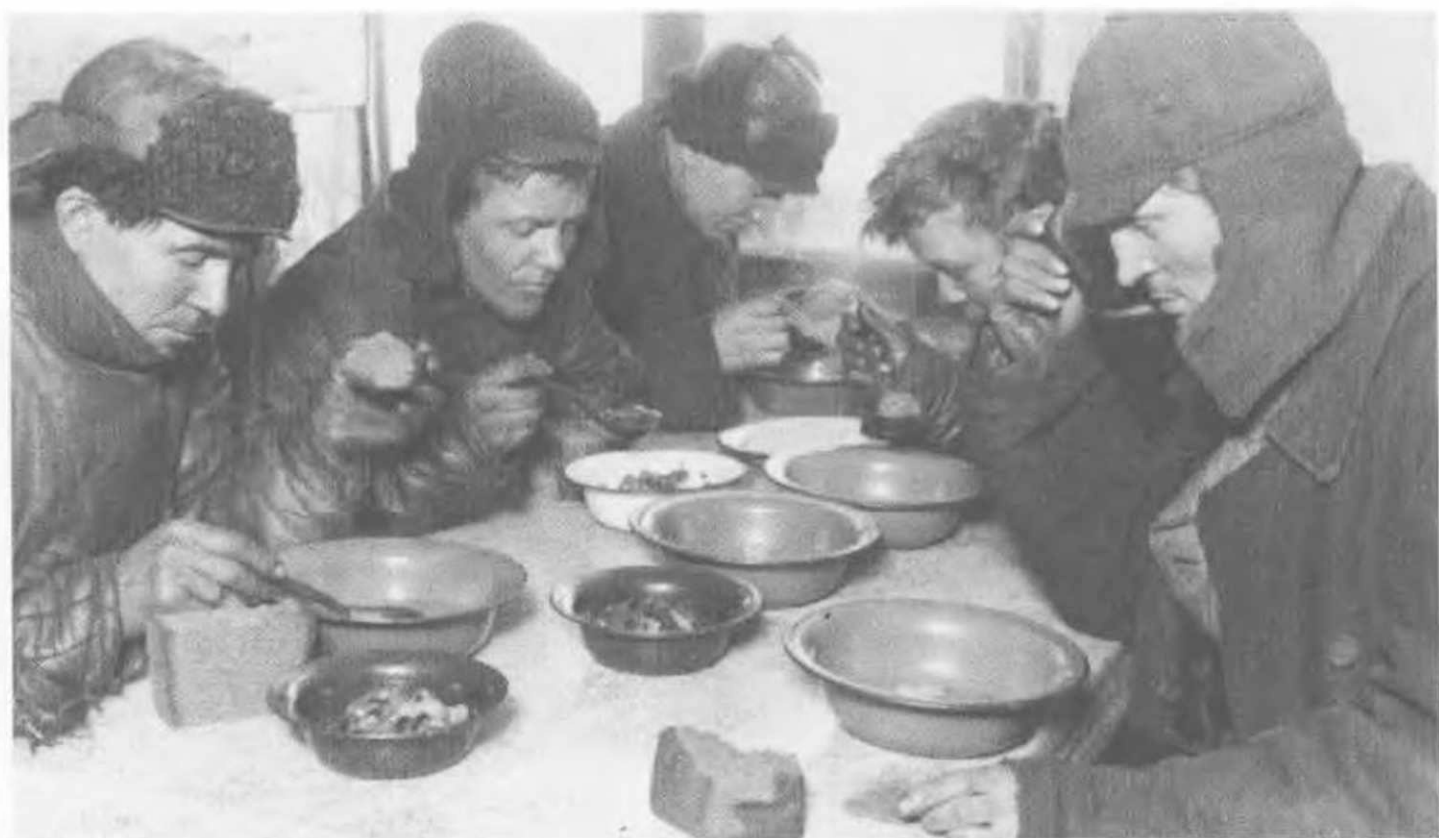
Заводские столовые на периферии существенно отличались от московских и ленинградских. На этой фотографии — рабочие Самары обедают в заводской столовой (1932). На столе обычная пища периода первой пятилетки — черный хлеб, щи, селедка.