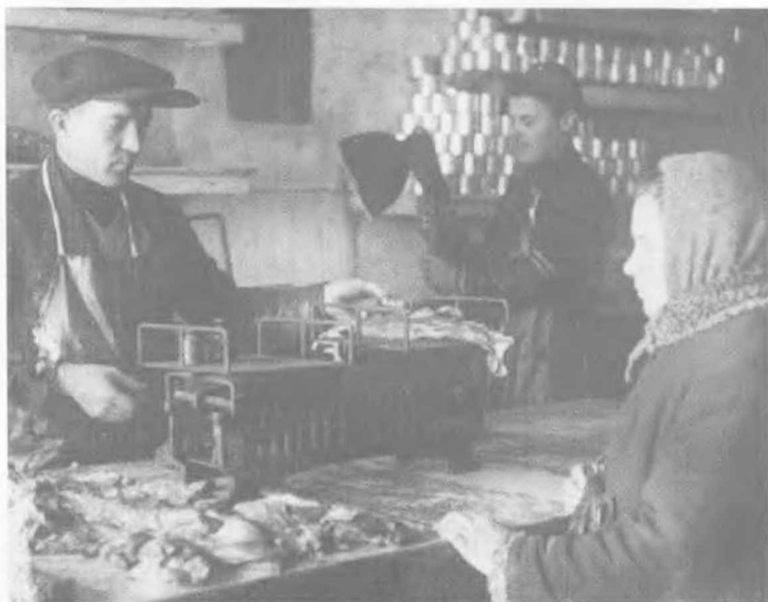
ЗРК завода им. Сталина, 1932. Мясной отдел. В момент введения карточек на мясо (июль 1930 г.) их получил только индустриальный авангард — 14 млн человек в более чем 160-миллионной стране. Но даже для них мясное снабжение было скудным.