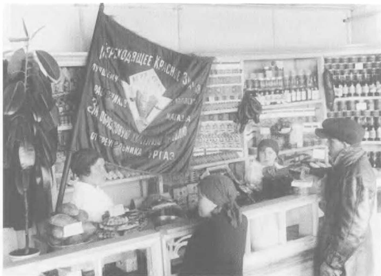
Гастроном автозавода им. Молотова, Горький, 1935. Ассортимент небогат. Обращает внимание обилие алкоголя и переходящее Красное Знамя лучшему трудовому коллективу торговли.