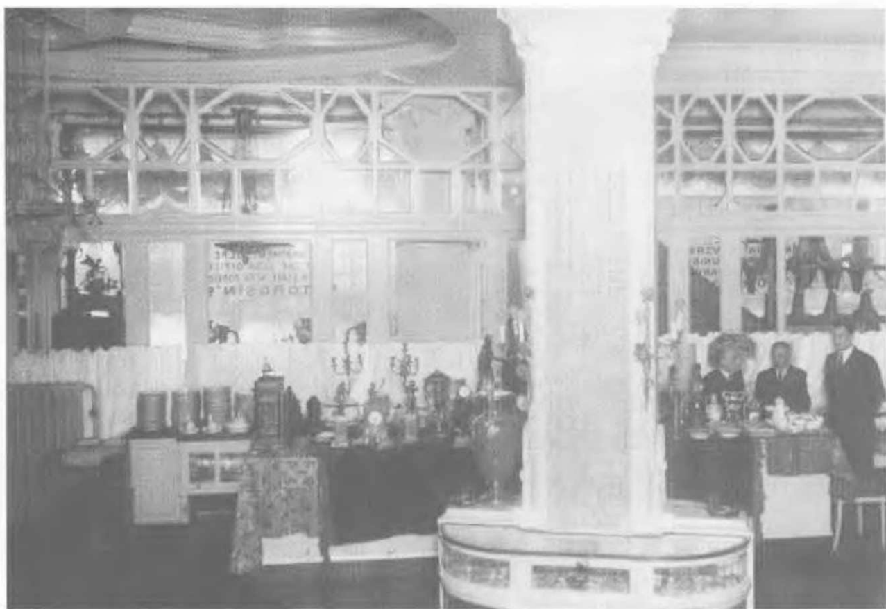
Москва, 1932. Антикварный отдел одного из московских торгсинов. Рекламное фото.