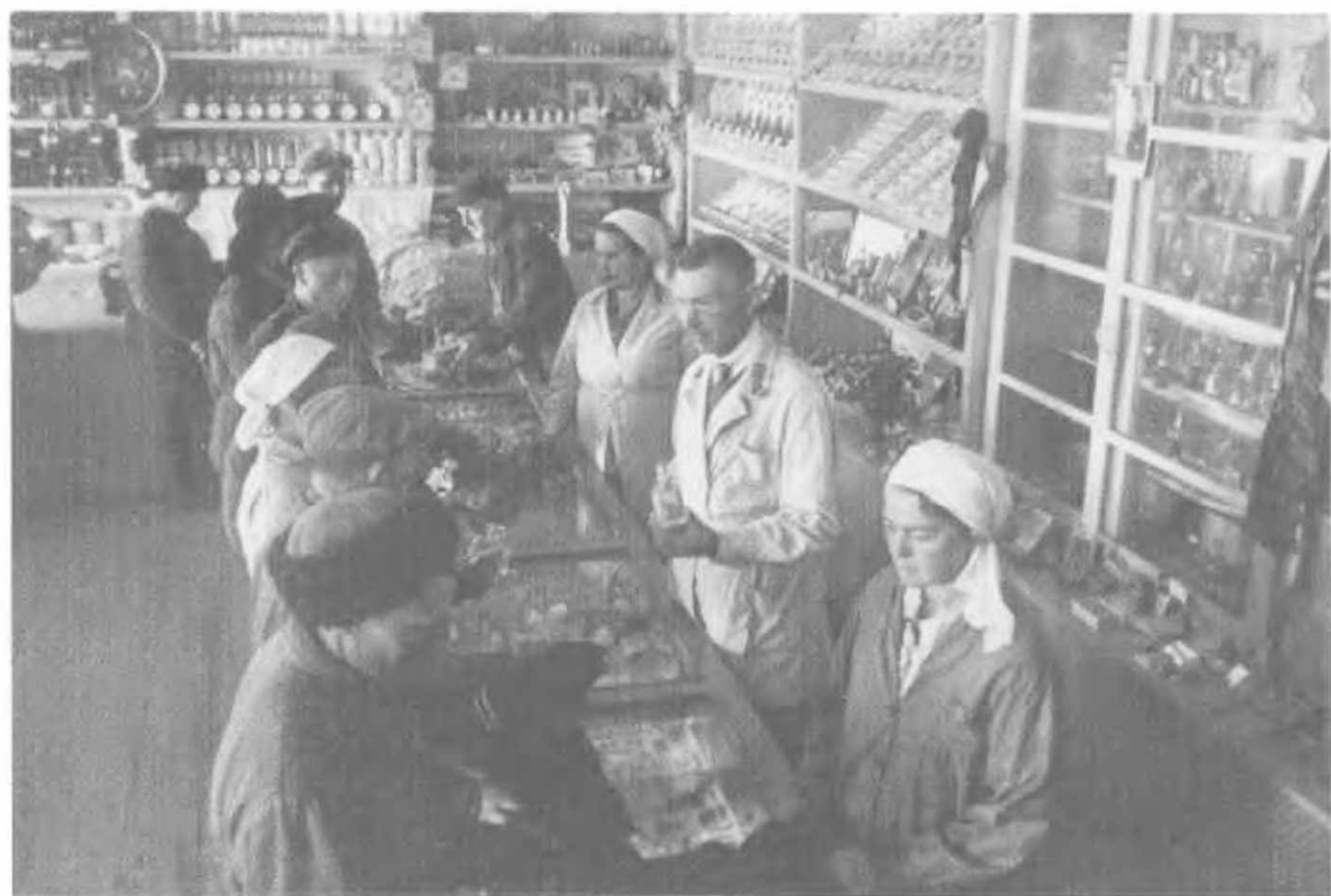
Образцовый сельмаг. Орджоникидзевский край, 1936.