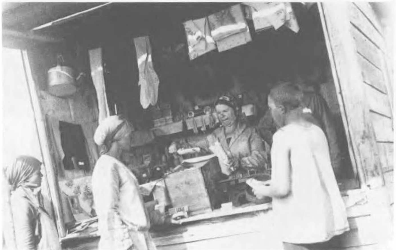
Колхозный ларек. Средне-Волжский край, 1934. Страна накануне отмены карточной системы. В ассортименте — по крайней мере два портрета Ленина, но крестьяне покупают продукты.