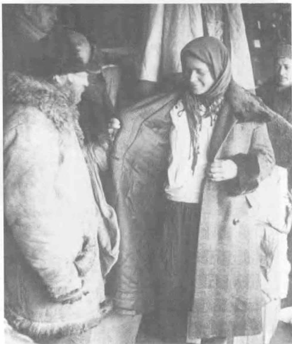
«К зажиточной жизни». Колхозник покупает дочери пальто. Сталинград. Снимок сделан в 1933 году. За кадром остались ужасы коллективизации, массовый голод, заградительные отряды, людоедство, эпидемии, беспризорные дети.