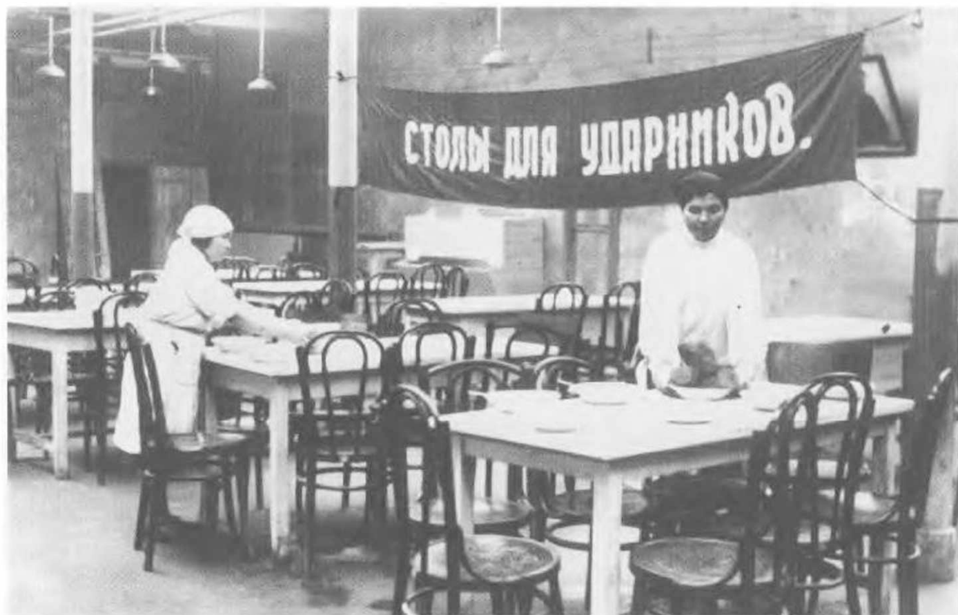
А вот и отдельные столы для ударников производства, о чем свидетельствует плакат. Специально отведенные для обеда столы и залы представляли еще одну попытку стимулировать ударный труд в условиях, когда ни зарплата, ни пайки не побуждали трудиться лучше (Ивановский меланжевый комбинат, 1931).