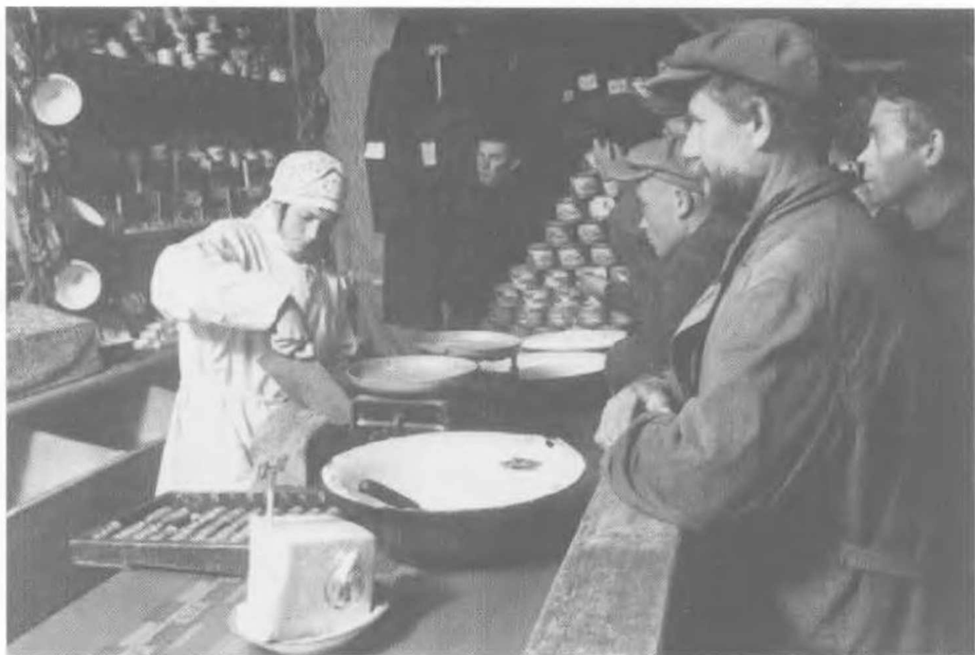
Вдали от крупных городов. Продовольственный магазин на Березовском руднике, Урал, 1937.