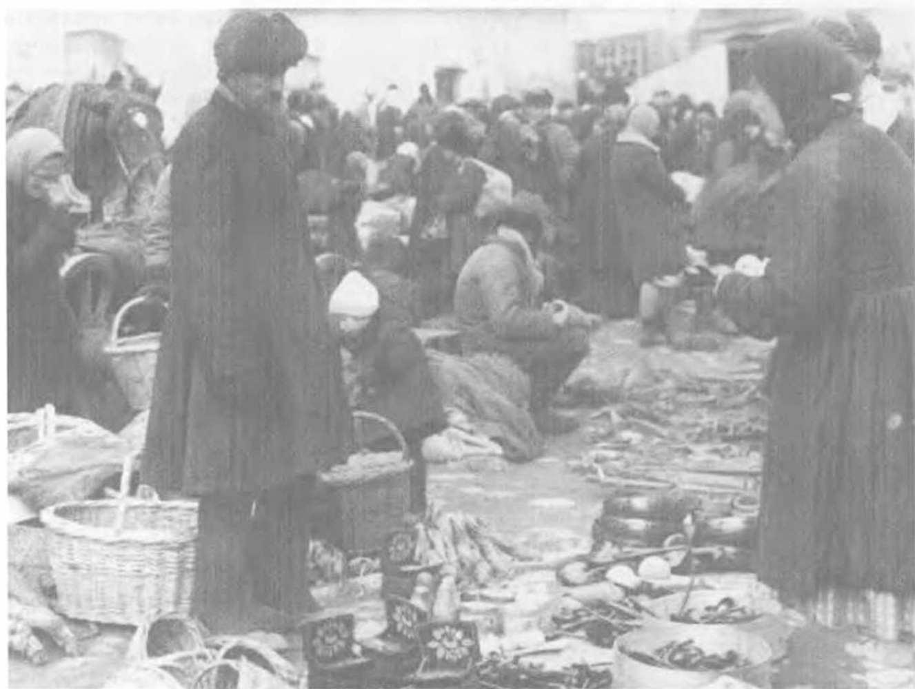
Торговля изделиями кустарных промыслов. Арзамас, Горьковский край, 1938.