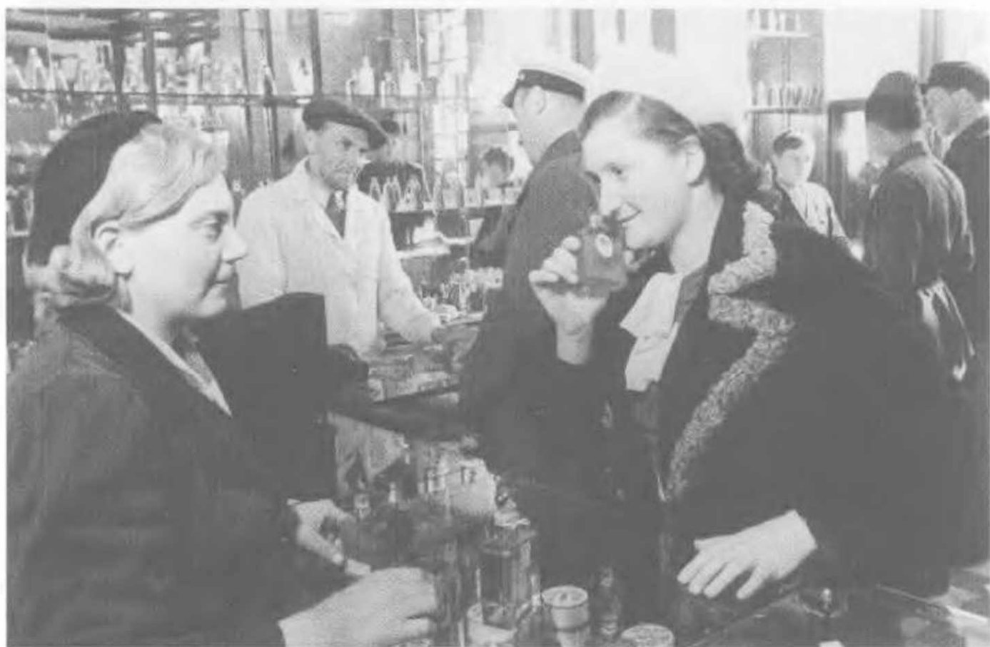
Парфюмерный магазин в г. Выборге, Карело-Финская ССР, 1940.