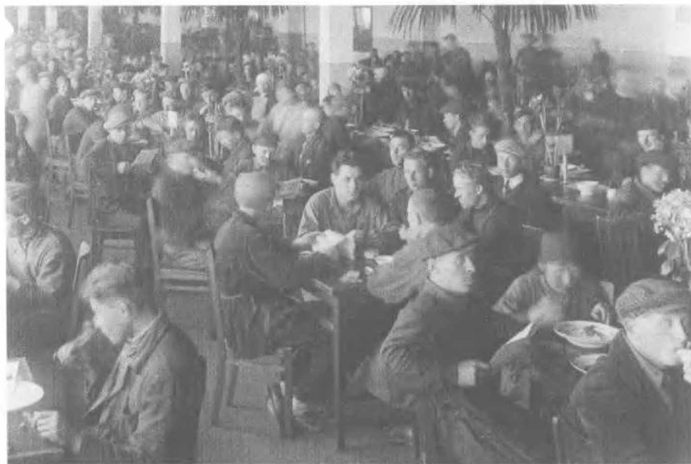
Ленинград, 1931. Обед в столовой завода им. Сталина. По внешнему виду и качеству питания столовые крупных заводов Москвы и Ленинграда относились к числу лучших.