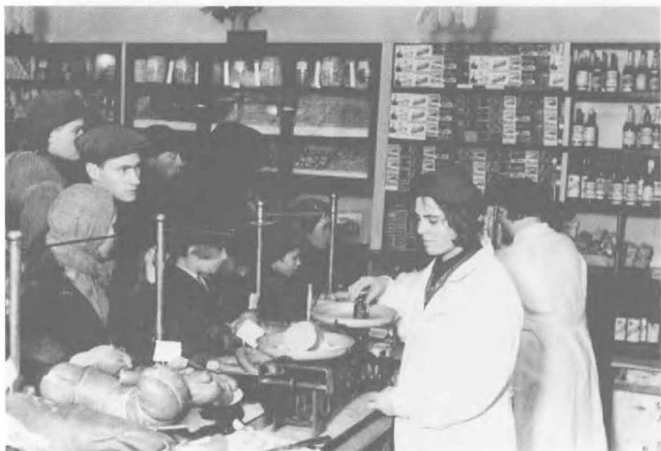
Универмаг в Московской обл., 1935.