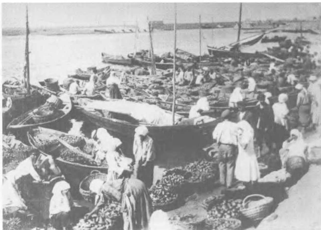
Овощной базар на баркасах на берегу Днепра. Херсон, Украина, 1938.