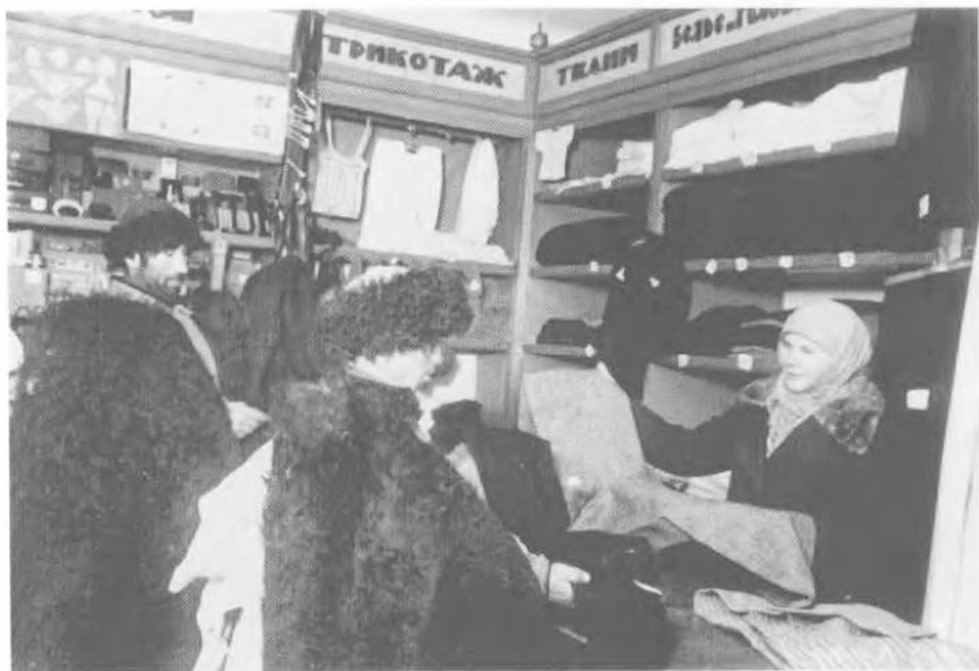
Райунивермаг в Карачаевской автономной обл., 1938.