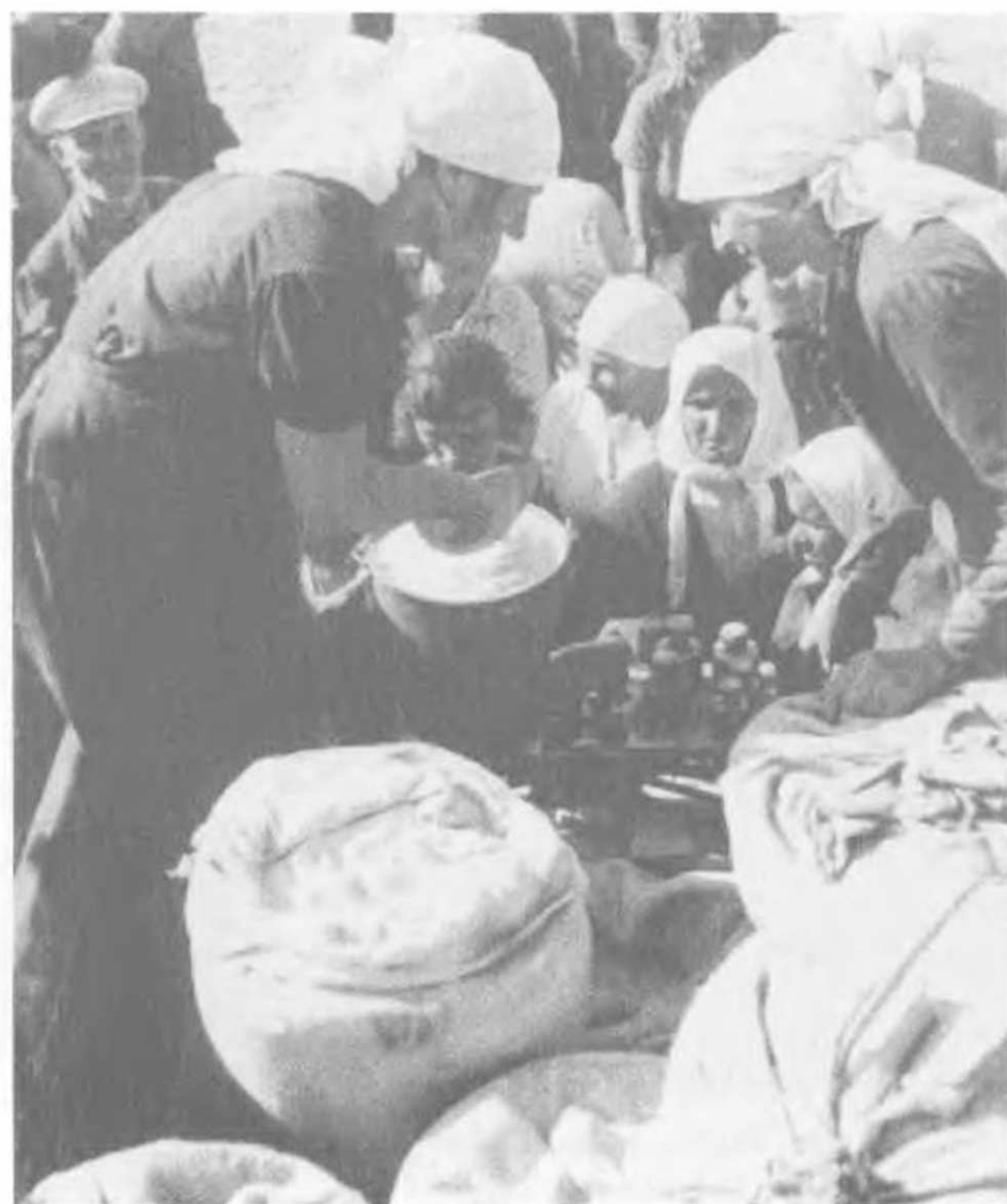
Продажа муки. Запорожье, Украина, 1938.