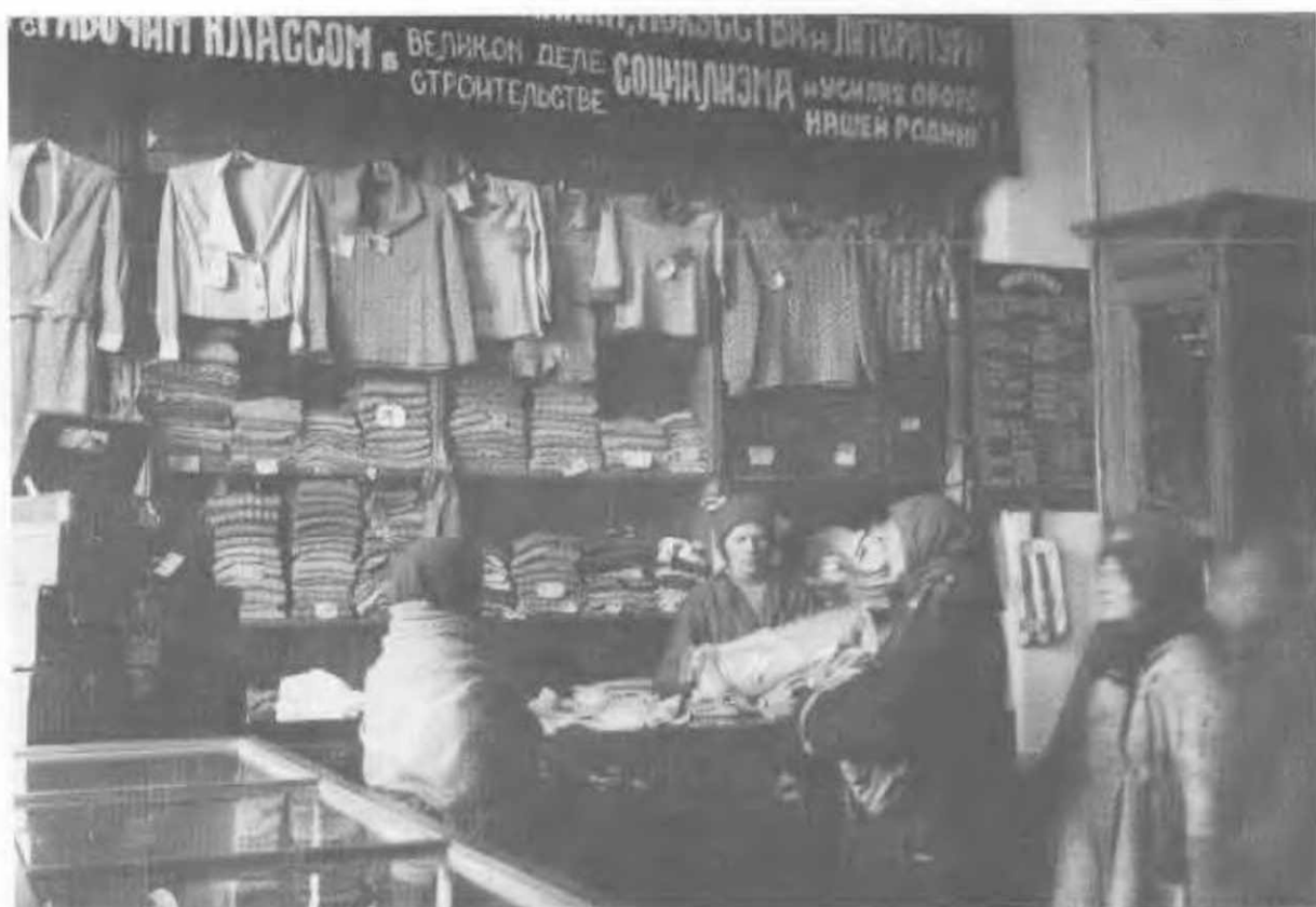
Магазин в Подмосковье, 1935.