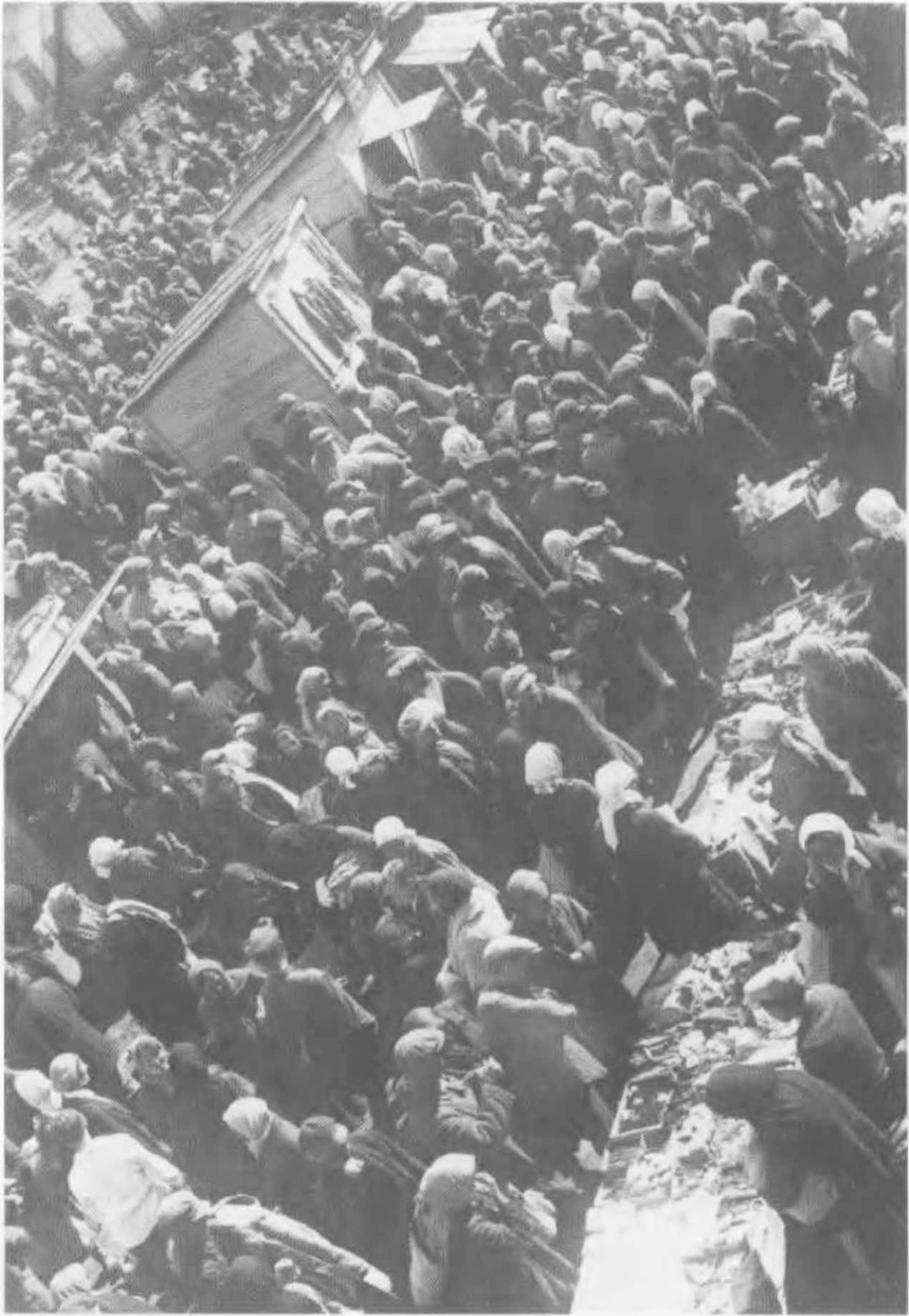
Толкучка, Центральная Черноземная область, 1933. Тысячи человек проходили через такой базар в воскресный день, покупая и выменивая товар. Лишь незначительная часть продавцов регистрировалась администрацией базара и уплачивала налоги с торговли, большинство меняли и продавали незаконно, в толпе, из-под полы.