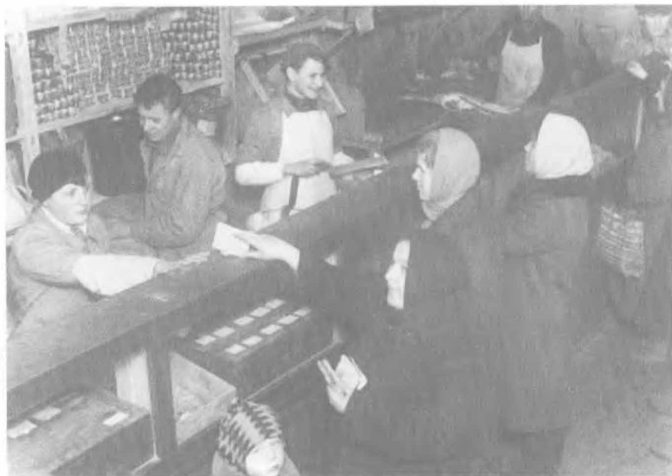
Закрытый рабочий кооператив (ЗРК) завода «Манометр», 1930. Скучный ассортимент: на полках банки с черным перцем, пачки фруктового киселя, очевидно, сметана в ведре, масло под ножом резчика, плохое мясо. Другие продукты идентифицировать не удалось.