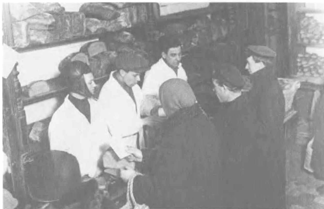
Выдача хлеба по карточкам в пекарне. Страна только вступила в продовольственный кризис, пока сохраняется разнообразие сортов хлеба. Но оно скоро исчезнет. Москва, 1929 год.