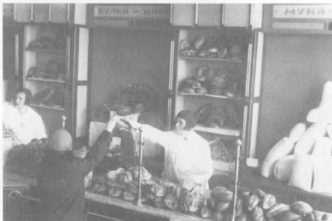
Первый год без хлебных карточек. Булочная Горьковского автозавода, 1935.