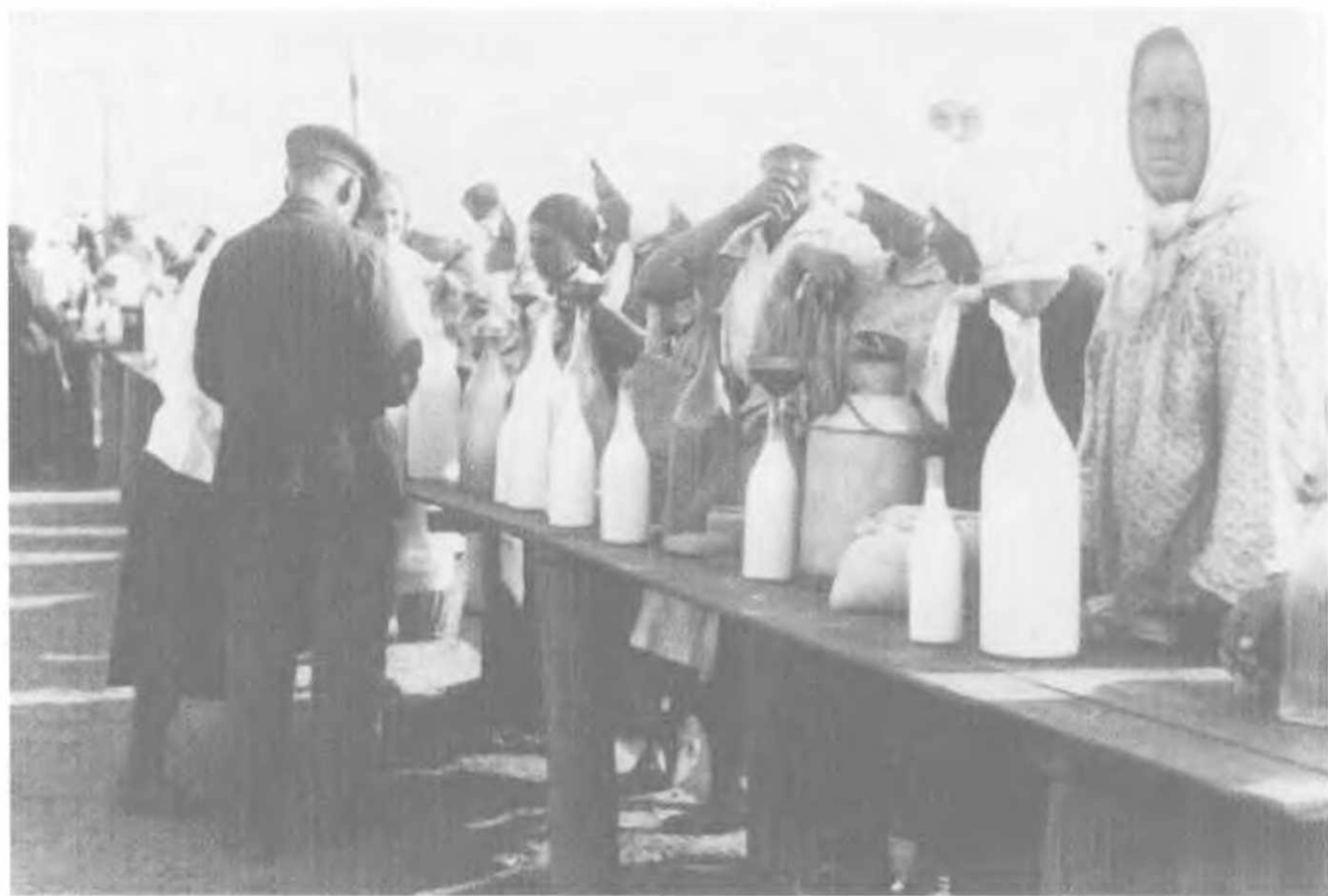
Торговля молоком. Донбасс, Украина, 1932.