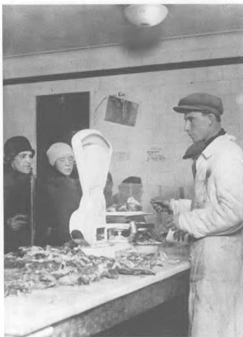
Мясной отдел в одном из московских магазинов, 1934. Фотография сделана не столько для показа мясного изобилия — оно оставляет жалкое впечат- ление, сколько для рек- ламы технической но- винки — автоматических весов.