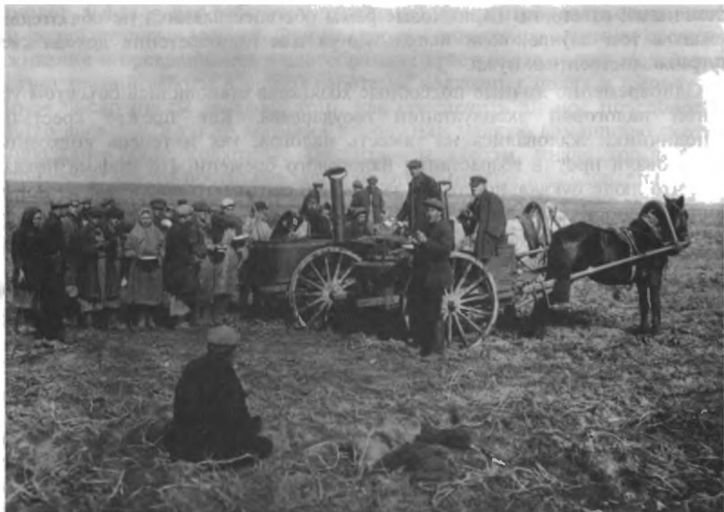
Обед в поле.