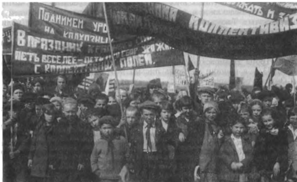
Детская демонстрация в подмосковном колхозе в период сплошной коллективизации.