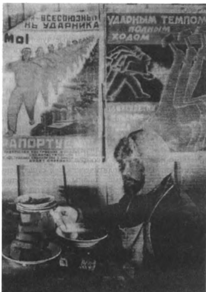
Рабочий на стройке в Магнитогорске.