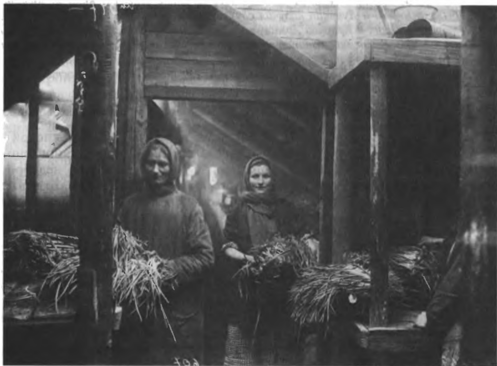
Колхозниці за роботою

Плакат на українському мові: «Ми повинні 1935 рік зробити роком високого врожаю при всяких кліматических умовах. (Постышев)»