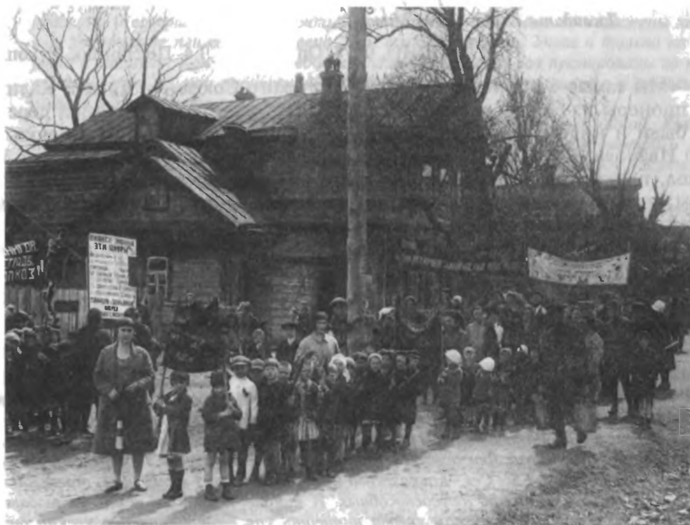
Марш под лозунгами «Ликвидируем кулачество как класс» и «Все на борьбу с вредителями сельского хозяйства»