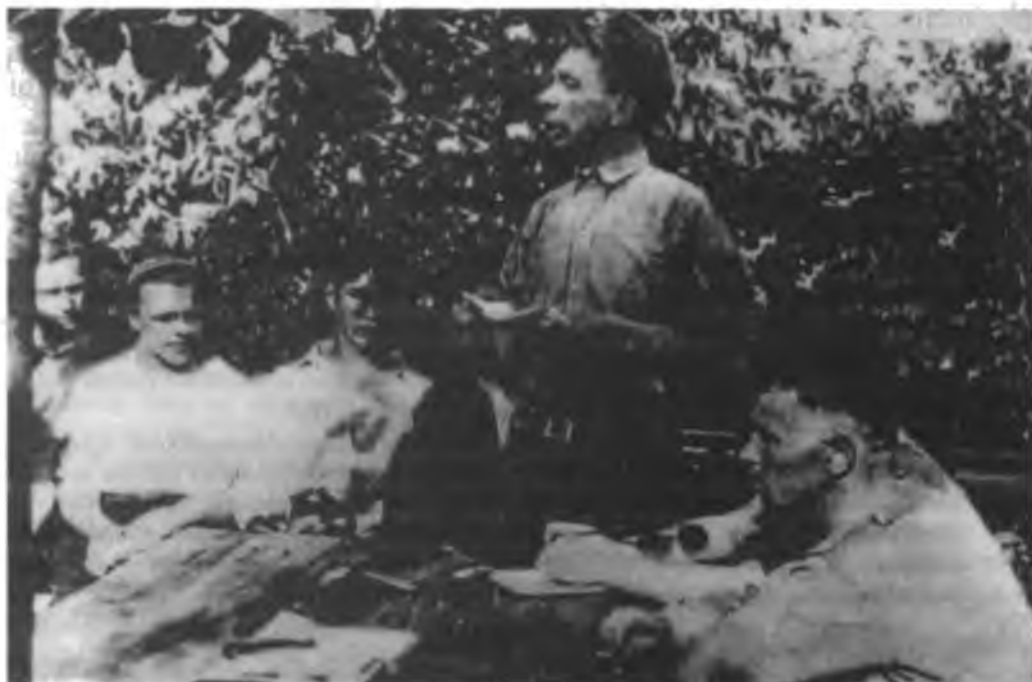
Обсуждение проекта конституции «на свежем воздухе».