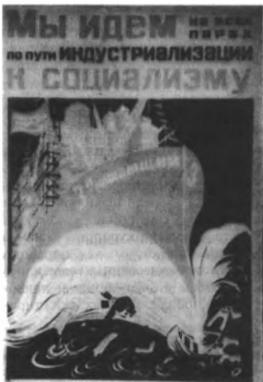
Советский плакат периода индустриализации. «3-й решающий» – 1931 год.