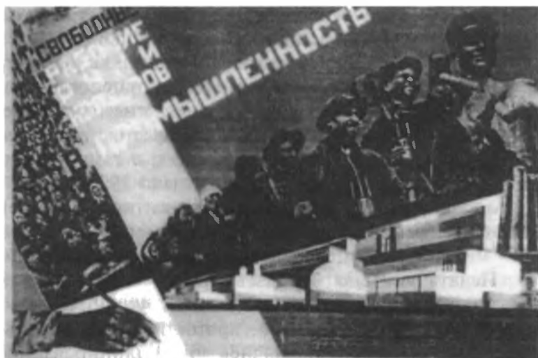
Советский плакат периода индустриализации.