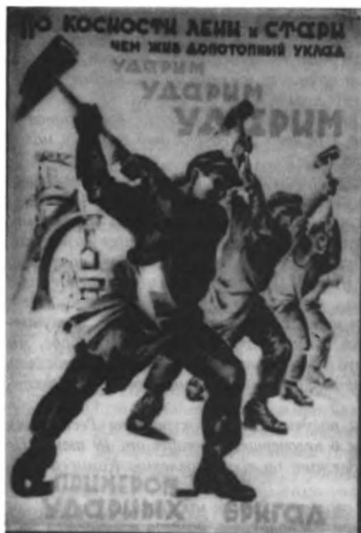
Советский плакат периода индустриализации.