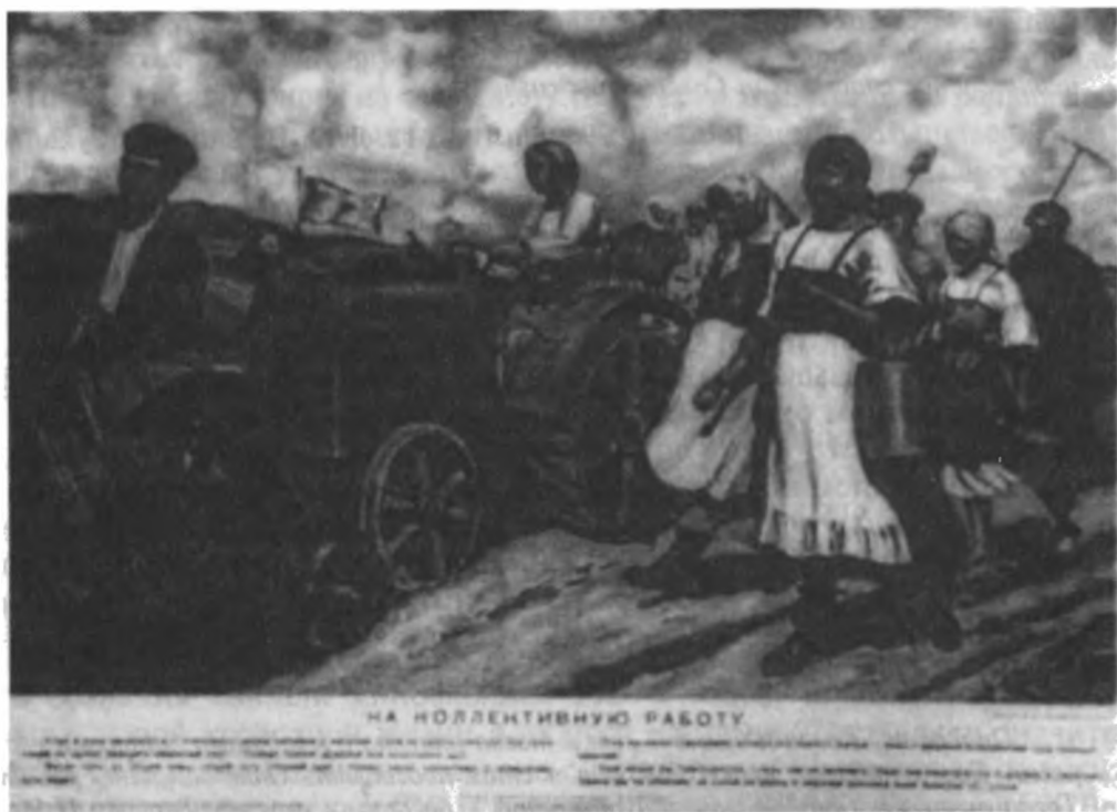
Советский плакат «На коллективную работу».