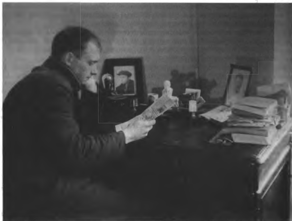
Молодой инженер «Станкозавода».