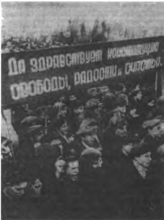
Демонстрация в Москве в честь принятия конституции. 6 декабря 1936 г.