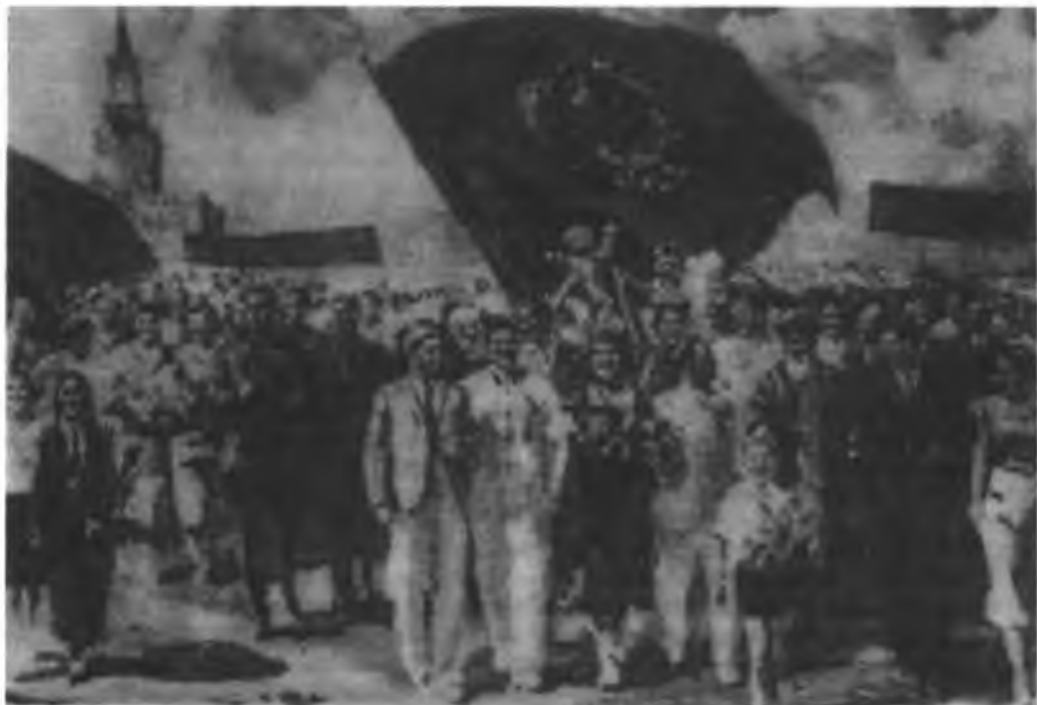
Эскиз к панно П.Ефанова «Знатные люди Страны Советов».