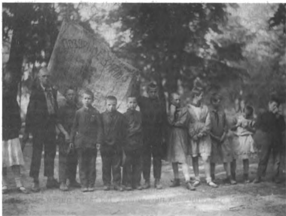
Лауреаты «Позорного знамени за черепаши темпы»