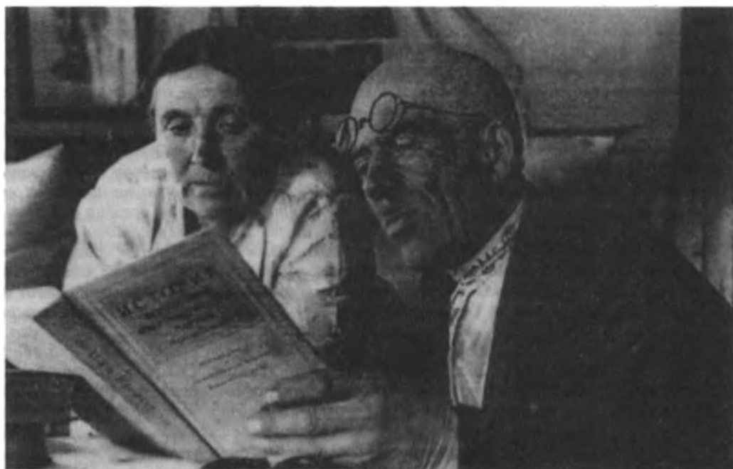
Изучение «Краткого курса истории ВКП(б)».