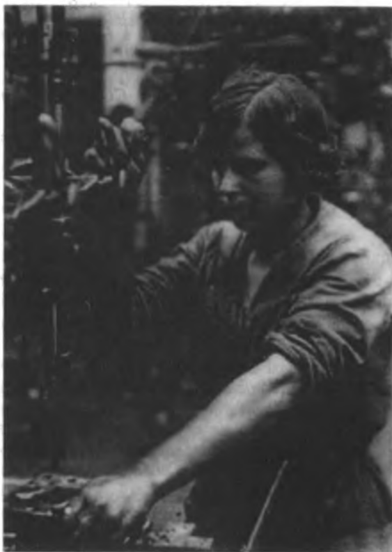
Молодая работница за сверлильным станком.