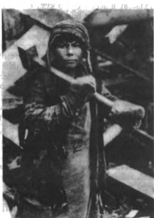
Молодой рабочий Магнитогорского металлургического комбината. 1931 г.