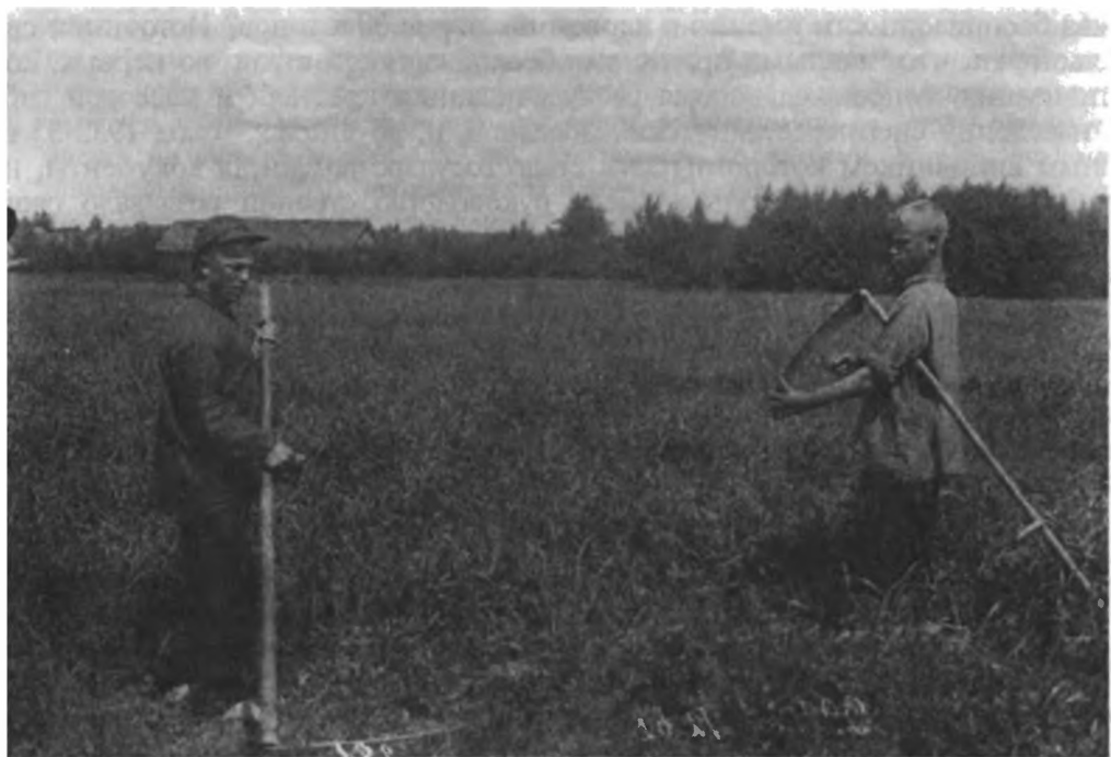
Практика: колхозные дети на покосе