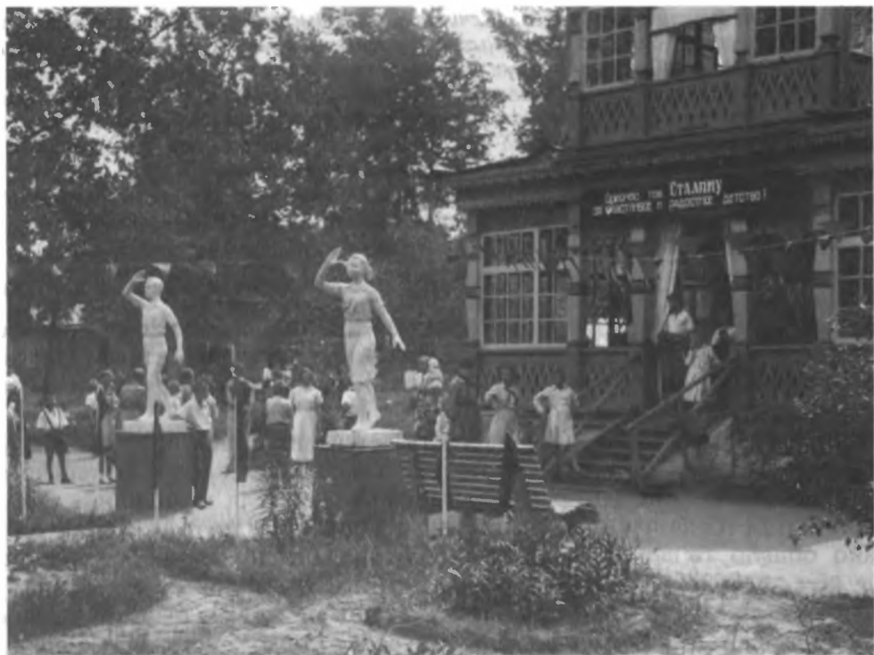
Летний пионерский лагерь