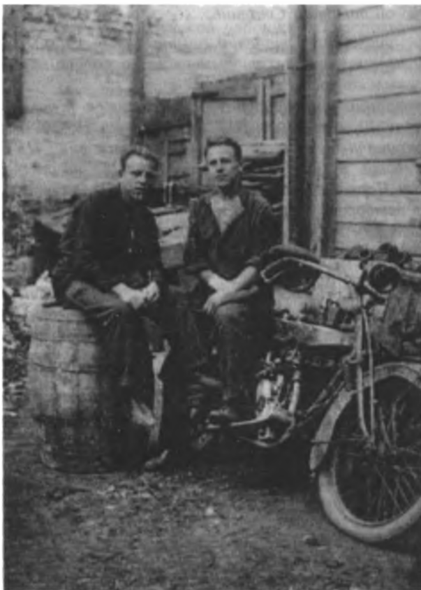
Стахановцы московского «Станкозавода» с премиальным мотоциклом.

«Пирамида» наиболее популярный номер художественной самодеятельности в 1930-е годы. Должна была демонстрировать чувство коллективизма и сопричастности к великим свершениям.