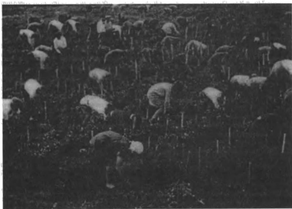
Уборка помидоров в подмосковном колхозе