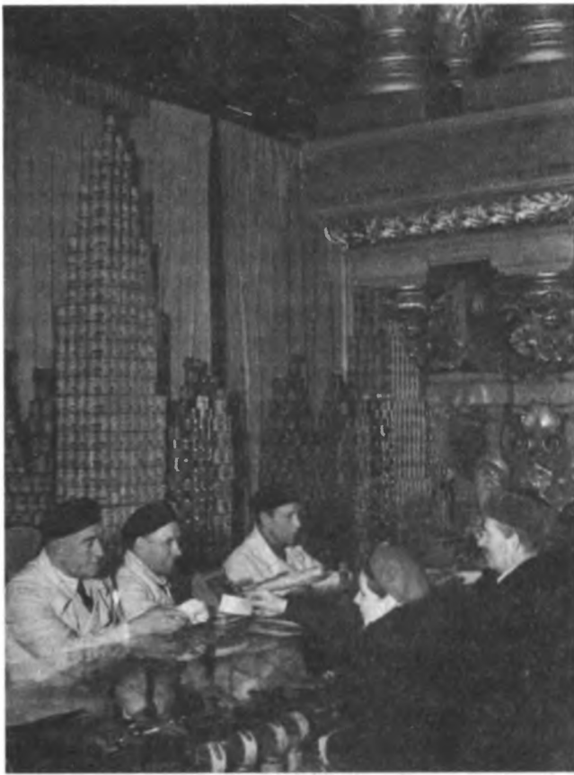
Рыбный отдел главного гастронома страны («Елисейского») во второй половине 1930-х годов.