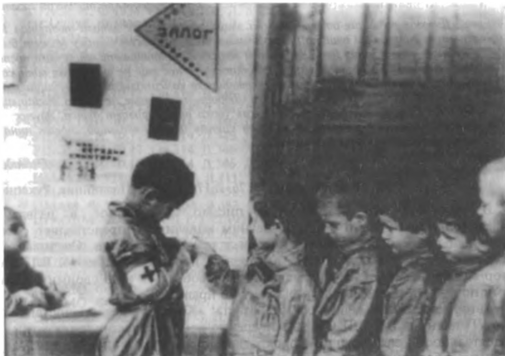
В детском саду Метростроя - санитарный день.