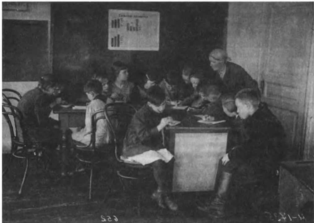
Теория: занятие школьного кружка по изучению сельского хозяйства