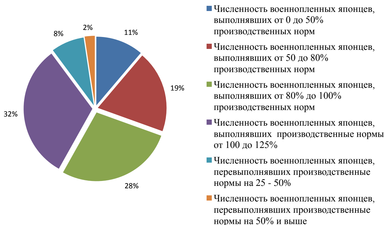
Диаграмма 2. Процентное соотношение численности категорий военнопленных японцев, не выполнявших, выполнявших и перевыполнявших производственные нормы (по данным за октябрь 1946 г.)

Средняя производительность труда, по расчетам сотрудников ГУПВИ, достигала 91% 252 . Средняя прибыль, получаемая от труда одного бывшего японского военнослужащего в день, к концу 1946 г. равнялась 13 рублям 95 копейкам 253 . В 1947 г. одними из важнейших задач, поставленных Главному управлению по делам военнопленных и интернированных на 1947 г., являлось повышение показателей производительности труда. В список задач на 1947 г. входило не только улучшение формальных производственных показателей, но и сохранение и улучшение здоровья военнопленных.