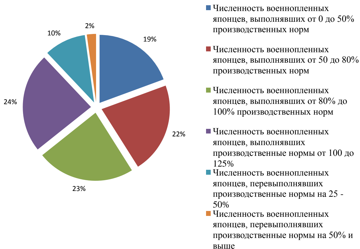
Диаграмма 3. Процентное соотношение численности категорий военнопленных японцев, не выполнявших, выполнявших и перевыполнявших производственные нормы (по данным за январь 1947 г.)

Таким образом, по сравнению с октябрём 1946 г., произошло снижение численности бывших японских военнослужащих, выполнявших и перевыполнявших производственные нормы, и увеличение численности японцев, не выполнявших производственные нормы, даже несмотря на то, что к ноябрю 1946 г. из лагерей было репатриировано более 25 тысяч нетрудоспособных японских военнопленных, а на их место из Северной Кореи были доставлены годные к труду японские военнослужащие. Средняя производительность труда, согласно данным ГУПВИ, за первый месяц 1947 г. составила 80,4% 254 и по сравнению с данными за октябрь 1946 г. снизилась на 1,6%.