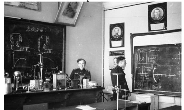
1948-1951 гг., 2-е МАПУ, в кабинете химии 741