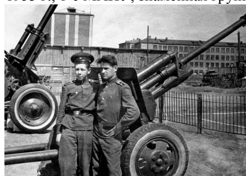
1951 г., 2-е МАПУ, в артиллерийском парке 753