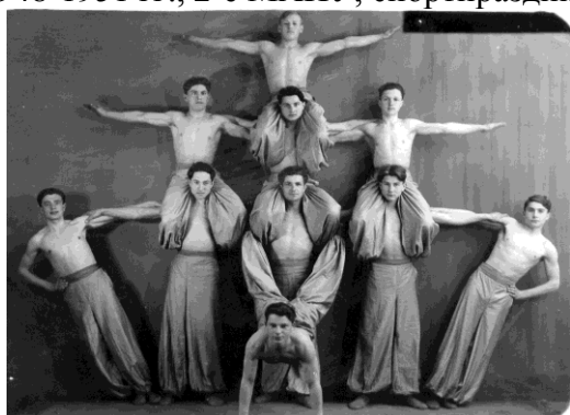
1947-1949 гг., ХАПУ, группа партерной гимнастики 752