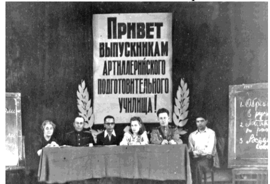
ХАПУ, перед вручением «аттестатов зрелости» 739