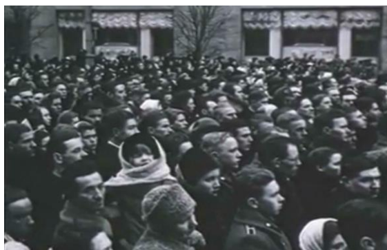
5 марта 1953 г., воспитанник АПУ или спецшколы ВВС (в шинели с погонами) слушает в толпе объявление о смерти И.В. Сталина 749