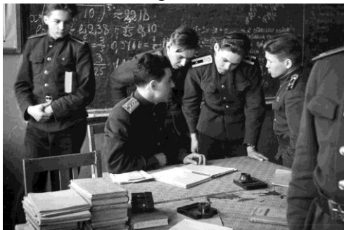
1948-1951 гг., 2-е МАПУ, после урока алгебры 740