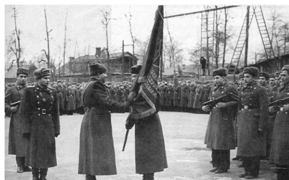
1953 г., 1-е МАПУ, знаменная группа 751