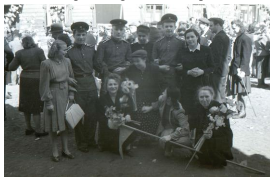
1948-1951 гг., воспитанники 2-го МАПУ после первомайской демонстрации 755