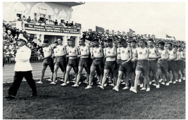
1953 г., 2-е МАПУ на III-й Спартакиаде СВУ, НВМУ и АПУ в г. Воронеже 737