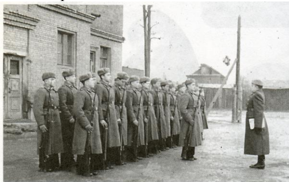
1952-1953 гг., 1-е МАПУ, занятие по строевой подготовке 738