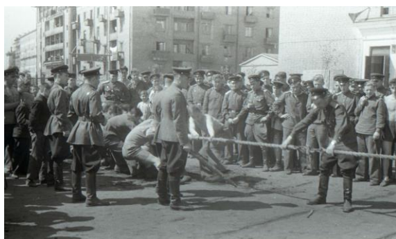
1948-1951 гг., 2-е МАПУ, спортпраздник 750