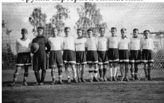
1947 г., сборная 2-го МАПУ по футболу 754