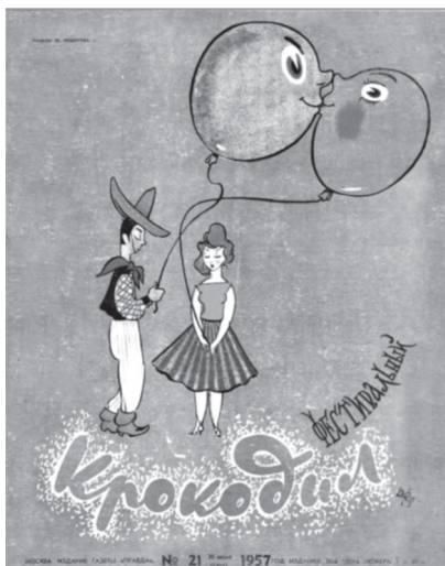
Рис. 1 [24].

Но есть ли место на этом празднике самой столице? Парадоксально, но её практически нет. Авторы о ней постоянно упоминают