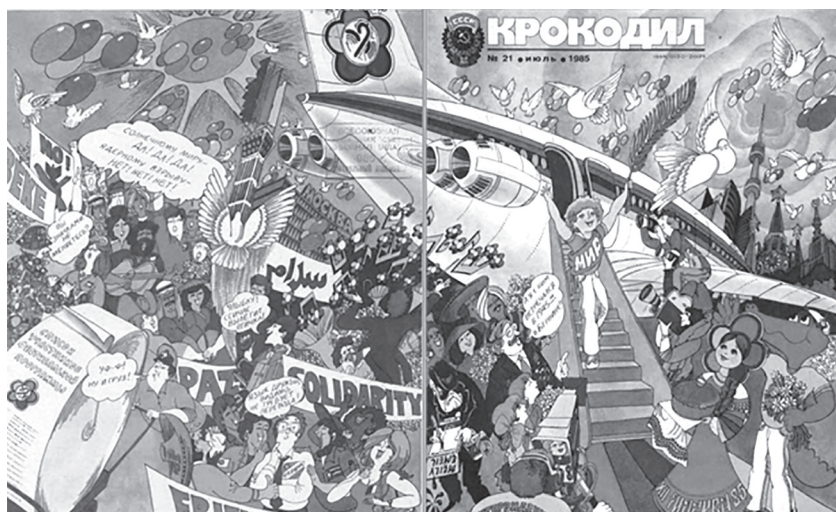
Рис. 4 [16].